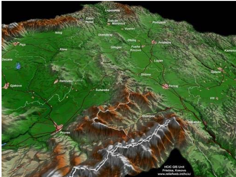
Перспектива без Срба? 3Д мапа Косова и Метохије са називима места искључиво на албанском

Оно што ће у петак у Њу Јорку понудити једна другој, делегације са највишим званичницима најавиле су још прошле недеље у Лондону: Косовари долазе са „уговором о добросуседским односима“, Срби насупрот томе са планом према коме би Косово функционисало готово као држава, али ипак без места у УН, без министарства спољних послова и без сопствене војске.