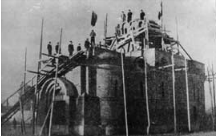
Изградња цркве посвећене Светој Тројици са костурницом у коју су смештени посмртни остаци ратника из периода Балканских и Првог светског рата — снимак из 1940. Ову цркву су почетком педесетих година прошлог века срушили комунисти.