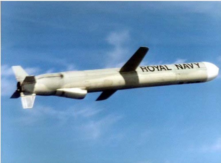
Америчка крстарећа ракета "Томахаawk"

Исто објашњење је значајно утицало и на то како је НАТО наступио на Косову 1999. Не само што смо наше акције ограничили на бомбардовање, ми смо то чинили са таквих