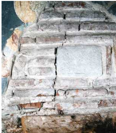
Оштећени зид Грачанице после бомбардовања 1999. године

Александра Мијалковић, Политика, 25. и 26. 09.07.