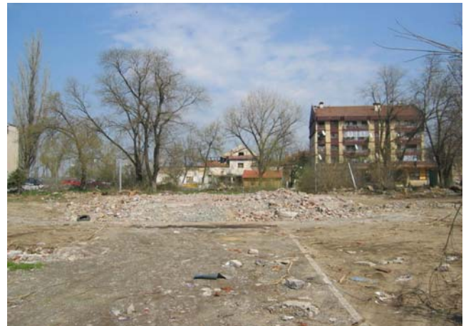
Ни остаци ове цркве нису остављени на миру. У мартовском погрому 2004. разуларена маса уклонила је и последње трагове постојања цркве. Сlike су спрoлеђа 2004. и сјесени 2005. - на месту цркве - сметлиште. Црква је скинута и са списка за обнову на захтев албанских представника заједно са манастиром Светих Архангела, гробном црквом цара Душана. А у Ђаковици су биле кости српских војника.