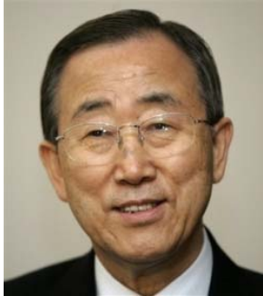
Бан Ки Мун

Откако је у јануару дошао на чело светске организације, Бан Ки Муну је полазило за руком да у неким стварима утиче на САД, али је такође знао да узврати услугу, због чега су му бројни критичари доделили етикету „највише проамеричког генералног секретара у историји УН“, пише „Вашингтон пост“. И један високи званичник Бушове администрације признао је да се Банови „инстинкти често поклапају са њиховим мишљењем.“