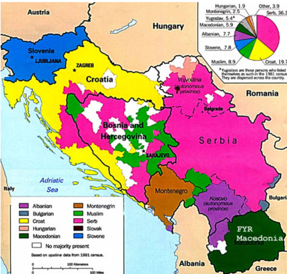
Етничка мапа бивше Југославије

Број Срба у Македонији је 1991. године износио 42 775, док према најновијем попису из 2002. године у овој земљи живи свега 35 938 припадника ове етничке заједнице. Као што се може уочити, број Срба у Македонији се за једанаест година смањило за приближно 16%. Разлози за то се могу пронаћи у исељавању великог броја запослених у некадашњој савезној администрацији, али и у постепеној асимилацији Срба.