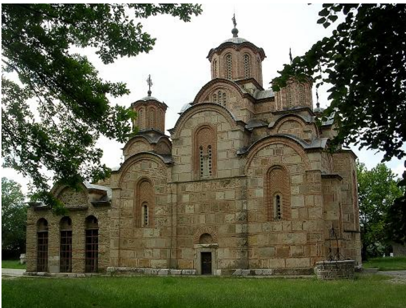
Манастир Грачаница (14. век) на листи светске баштине UNESCO-а

„Свака крава у Француској је субвенционисана са три евра дневно, док сваки други Косовар живи од трећине те суме. Уколико га опљачкају, мале су шансе да ће починилац бити икада ухаћен, иако је на Косову највећи број полицајаца по становнику у Европи. У судовима чека 30.000 нерешених случајева. Уколико сте Ром или Србин на Косову, могло би вам