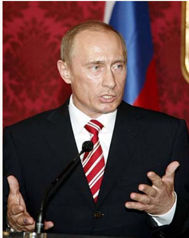
Председник Русије В. Путин

Путин је на Прес конференцији у Сочију после сусрета са шпанским премијером Хозеом Луисом Сапатером истакао да Русија не сматра целисходним стављање косовског про-