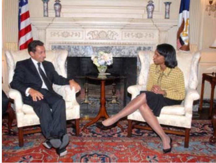
Никола Саркози и Кондолиза Рајс

У уторак, за мање од једног сата, уље на ватру прво су сасули Никола Саркози и Кондолиза Рајс. Француски председник саопштио је новинарима (задржавајући се много дуже на многим другим, за њега важнијим темама) да, једноставно, независно Косово "ни за кога не би било проблем"... Амерички државни секретар била је на сличној таласној дужини, али још конкретнија и отворенија. "Косово ће бити независно. Ми смо посвећени томе. То је једино решење које ће потенцијално донети стабилизацију Балкана, уместо дестабилизације", рекла је Рајсова, изражавајући забринутост да "ниједна страна неће бити спремна да озбиљно преговара" кад их посредници поставе очи у очи ("Срби су уверени у руски вето на резолуцију Савета безбедности која би признала независност Косова, док косовски Албанци осећају да могу да рачунају на америчко признавање проглашења независности"). Кондолиза Рајс је том приликом посебно нагласила да је Стејт департмент упозорио косовске преговараче да "једнострано проглашење независности не би би-