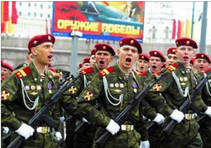
Руски војници на прослави 60 година победе у II светском рату

Београд - „Једно је бити нечији партнер и равноправни сарадник, а сасвим друго члан организације која подразумева стриктне, скупе, тешке и не увек праведно распоређене обавезе. Како је