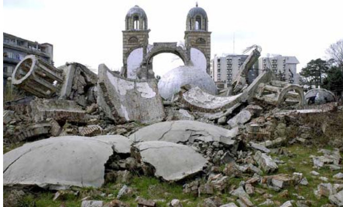
После доласка миротворачких трупа, од јуна 1999, црква је рушена и срушена