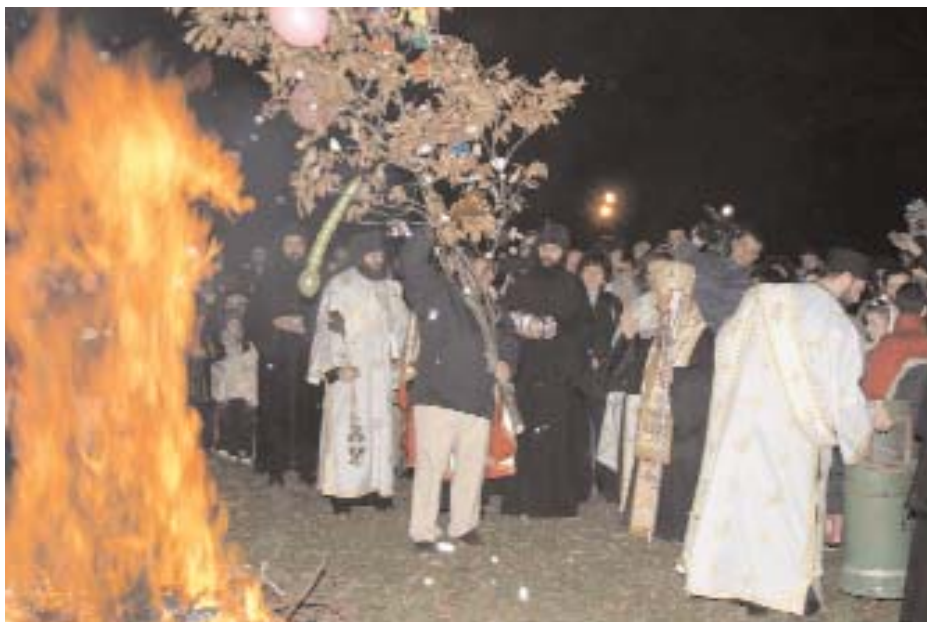
Владика Артемије благосиља налагање бадњака у порти манастира Грачаница

Мудраца, шћреба да прннесемо своје Снaсннeљу. Ми смо хришћани призвани на савршенствo, јер смо сащричасни Свeсавршеном Богу. "С нама је Бог" значи да смо ми дужни да будемо пример вере, наде и љубави у овом духовно једном и колебљивом свету. "С нама је Бог", и нека Он делује кроз нас