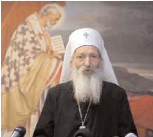
Његова светост Патријарх Павле

које испуњавају овај свет. Колико је суза само на овим просјорима проливено у историји? Зар нисмо у овој години славили два века од Првог српског устанка и ослобођење од вековног ројства, сећивши се наших светих и славних предака, који су показали љубав од које нема веће, да живош свој положе за ближње своје (Јн 15,13). Сећајући се њих и тих великих дана, нама као поштомцима ових дивних Христолубаца и браћолубаца, срца су била испуњена радошћу. Нажалост, шолико је рашова, убисћава, злочина, сваковрсних нејравди и понижења било и у ових двеста година. Колико је деце остало без родитеља, колико родитеља без деце, колико суза проливено за родним прагом, за водом која нас је прво зајојила, за ваздухом који смо прво удахнули? И треба ли још набрајати све невоље у долини плача, како овај наш свет назива оца Јусин Побовић. Мир Божиј, који овај дан доноси, недостајао је нашем народу више од хлеба.