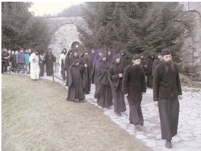
Долазак Патријарха у Дечане

Након литургије, на којој се причестио велики број верника и