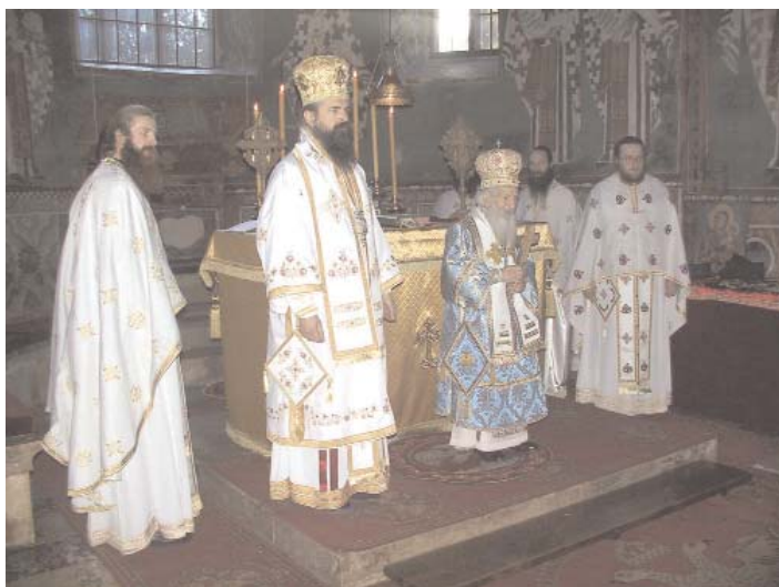
Његова Светост Патријарх Павле, епископ Теодосије и дечански јеромонаси на светој архијерејској литургији у манастиру Високи Дечани, 8. јануар 2005

нарочишо деце, владика је делио божичне поклоне најмлађима. Поклоне су обезбедили разни донашори, међу којима и амерички КФОР. Током литургије рукоположен је нови свештеник, ошац Горан Ковић (рођен 1964. у Прњавору, Босна), који ће дужности парохијског свештеника обављајти међу Србима повраћеницима у