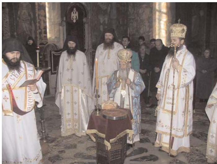
Патријарх Павле сече славски колач у част Јосифа Обручника заштитника манастирске дуборезачке радионице

Он се у краком разговору задржао са мештанима Брестови-