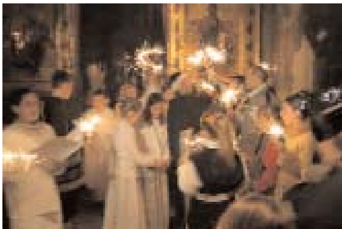
Бадње вече су посебно радосно прославила деца у грачаничкој цркви кроз играоказ о Рођењу Христовом

У овој духовној радости, браћо и сестре, желимо да Вам честитамо и настуйајућу Нову 2005. годину, са вером и надом да нам она буде благословена, да донесе више мира, слободе и правде међу људе на земљи. На почетику ове нове године треба да се сећимо и речи свећог апостола Павла који говори: "Невоља и шуга на сваку душу човека који чини зло... а слава и часћ и мир свакоме који чини добро" (Рим. 2, 9 - 10), како бисмо се шоком