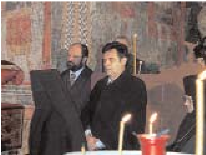
Божићној литургији у Пећкој Патријаршији, присуствовао је и премијер Коштуница

"Празник рођења Господа Исуса Христа је празник мира, празник радости, празник прашћања када нас богороденац Христос окућља око своје Вишлејемске ђеине, око јаслица у којима се родио. Од слављења Бога, од прадавања себи вољи Божијој зависи и мир нас унутрашњи и мир сљољашњи. Онај