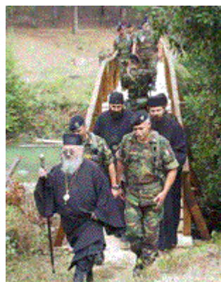
Slika 1: U poseti Srbima u Gorazdevcu