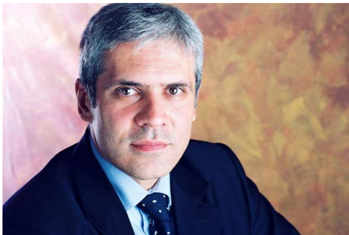
Председник Републике Србије Борис Тадић