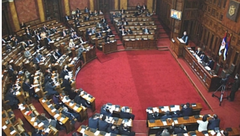
Са скупштинског заседања