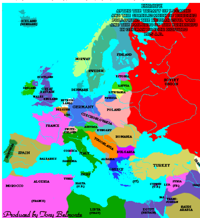
Европа 1925. године

Право народа да се конституише први је формулисао амерички председник Т. В. Вилсон почетком 20. века. Његов принцип националности прихватио је и В. И. Лењин, формулишући га као право на самоопредељење и отцепљење. Вилсонов принцип није примењиван код оних нација које су формиране у државама које су постојале пре него што су створене нације – Велика Британија, САД, Француска. Оне су своје поданике мобилисале тако што су их претвориле у равноправне грађане. Принцип је примењиван само у државама у којима су нације формирали припадници етничких или културних скупова које се нису подударале с постојећим државама империјама – попут Турске, Аустроугарске и Русије.