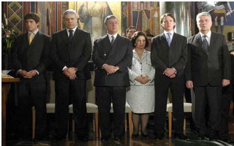
Борис Тадић са Њ.К. Височанством Александром и његовом породицом

Истраживања говоре да рејтинг радикала није толико растао због националне фрустрације, већ на таласу великих социјалних проблема, од незапослености до огромних социјалних неправди. Осећати ли ви, као лидер странке која је члан Социјалистичке интернационале, одговорност због тога?..