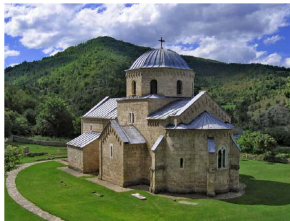
Манастир Градац (13. в.), задужбина краљице Јелене

Срећне Божићне и Новогодишње празнике жели Вам