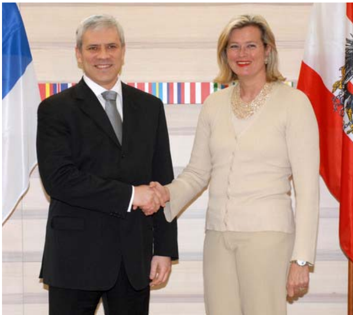
Борис Тадић и Урсула Пласник, аустријска министарка спољних послова

Јесте ли разговарали са премијером Коштуницом о условима које је поставила народњачка коалиција?