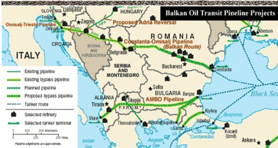
Проекти балканског транзитног нафтовода

не схватају да би национална независност постала нешто недостижно за Србе. Осим тога, да ли се праве да не увиђају да би Косово свакако остало под управом НАТО, тј. независно од Србије?