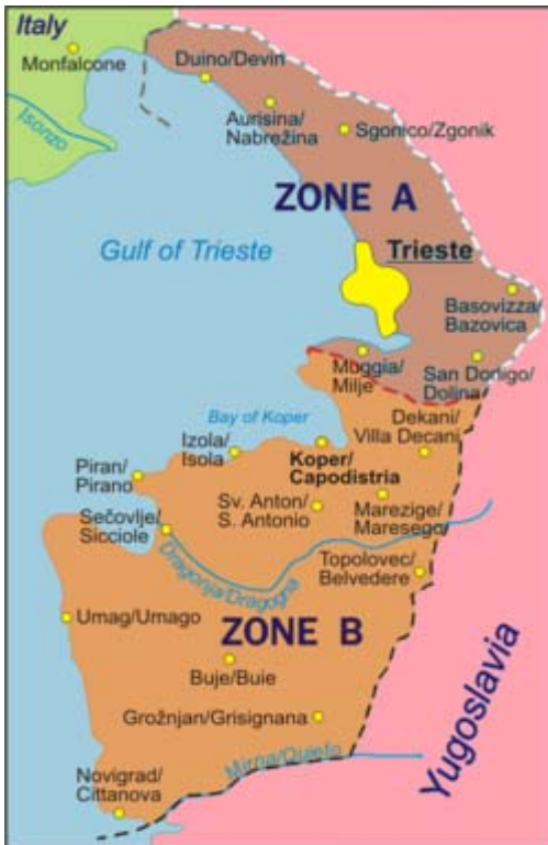
Област Трста подељена на Зону А и Зону Б

После Првог светског рата тзв. „ријечко питање” постаје велики међународни проблем; Италија је срчано захтевала своју Fiume , али у Версају се за Ријеку није изборила нити је добила, све до краја конференције. Онда је на притисак великих сила Краљевина СХС приста да потпише Рапалски уговор са званичним Римом, новембра 1920, којим обе стране признају потпуну слободу и независност државе Ријека и обавезују се да ће то вечно поштовати.