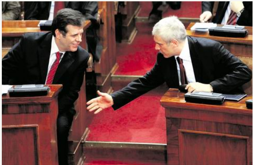
Коштуница и Тадић јуче у Дому Народне скупштине

Народна скупштина Републике Србије на седници одржаној 26. децембра 2007. године доноси