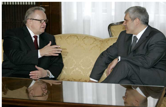
Борис Тадић у разговору са Марти Ахтисаријем, специјалним изаслаником ГСУН за Косово

Причали смо о критикама које упућује опозиција. Део владајуће коалиције је, међутим, веома јасно отворио дилему – Европа или Косово?