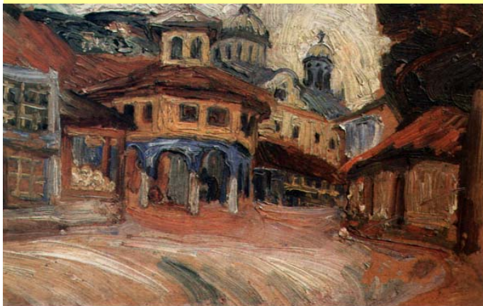
Надежда Петровић - Стари шедран у Призрену (1913)

Забележио Никола Ј. Мариновић у Призрену 1988