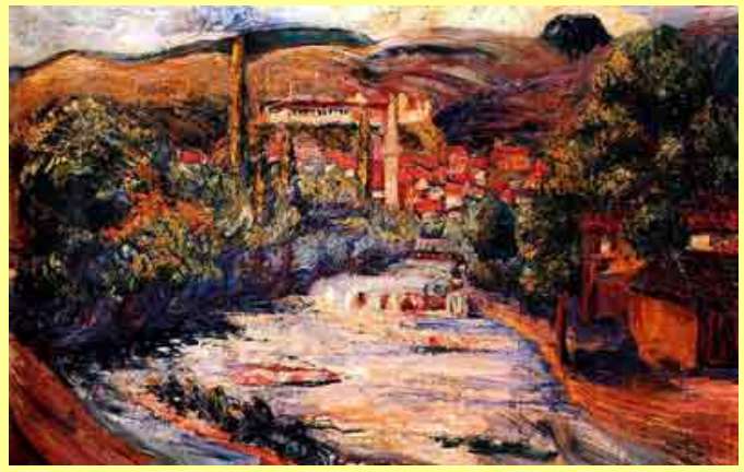
Надежда Петровић - Стари Призрен (1913)