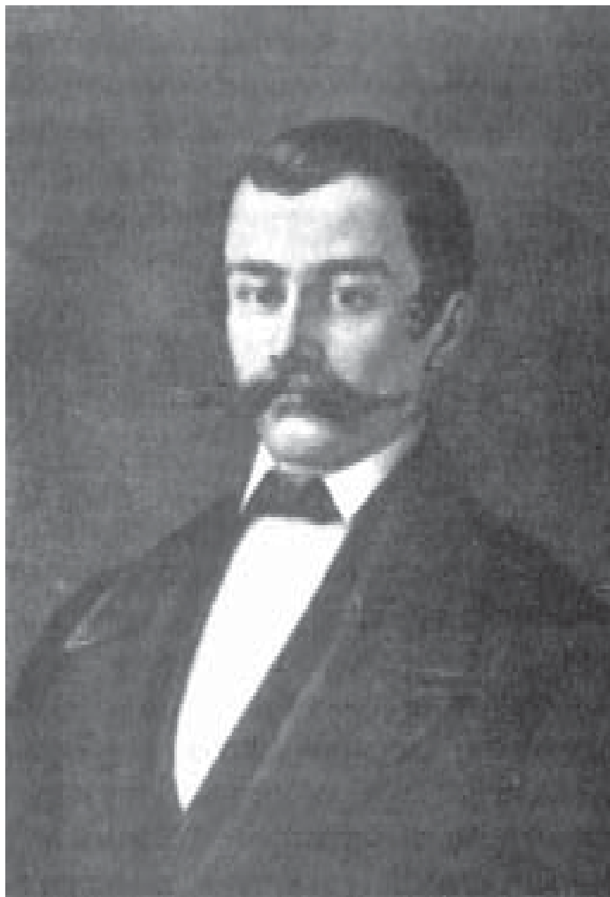
Иван Југовић, рад непознатог сликара