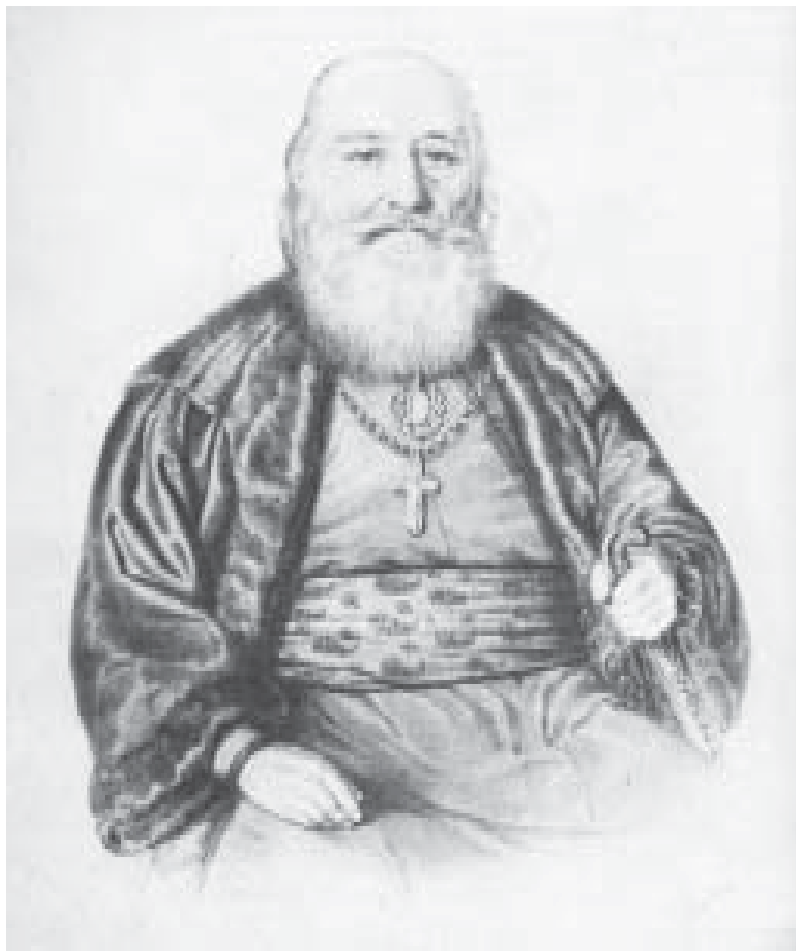
Прота Матија Ненадовић, литографија А. Јовановића (1850)