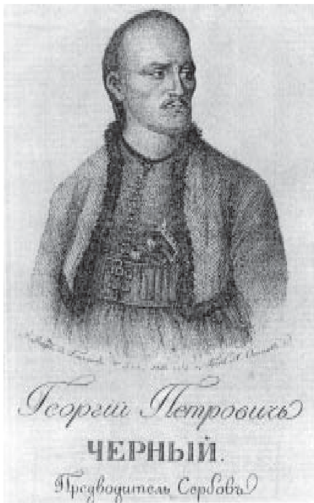
Портрет Карађорђа, гавира Ж. Ф. Робера (1808)