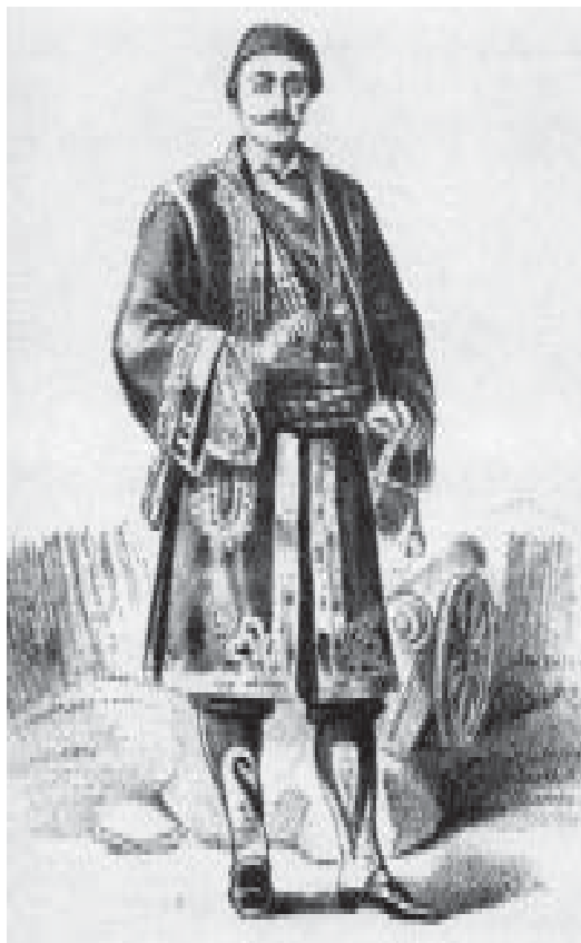
Хајдук Вељко Петровић, К. Ненадовић

стафа је пред смрт признао Вељка за бољег јунака и послао му коња и сабљу, да му после смрти гори јунак коња не јаше и сабљу не паше. Догађај је опевала и лирска песма која још додаје да је Дели-Кара Мустафа Вељку послао и своју верну љубу, да је љуби и да се хвали, јер је бољи јунак. 314