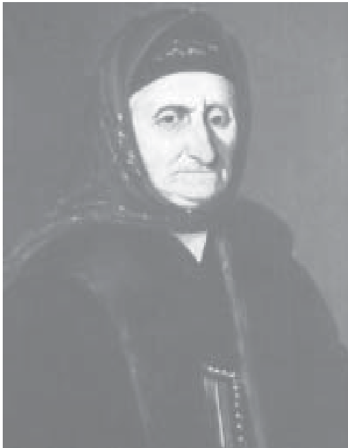
Портрет Јелене Карађорђевић, Јован Поповић

Црни Ђорђе би се расположио када би попио, али је будући неумерен у пићу, тада постајао свадљив и opak. Руски посланик, Родофиникин који је такође био склон пићу, увидео је да Вожд не подноси алкохол баш најбоље и заносио се мишљу да га одвикне од ракије. Покушао је код њега да створи навику пијења чаја и послао му је уз чај упутство како се напитак припрема и уз то још и рума. Баш када се Вожд привикао на чај, понестало је рума и он се поново приволео ракији. 292