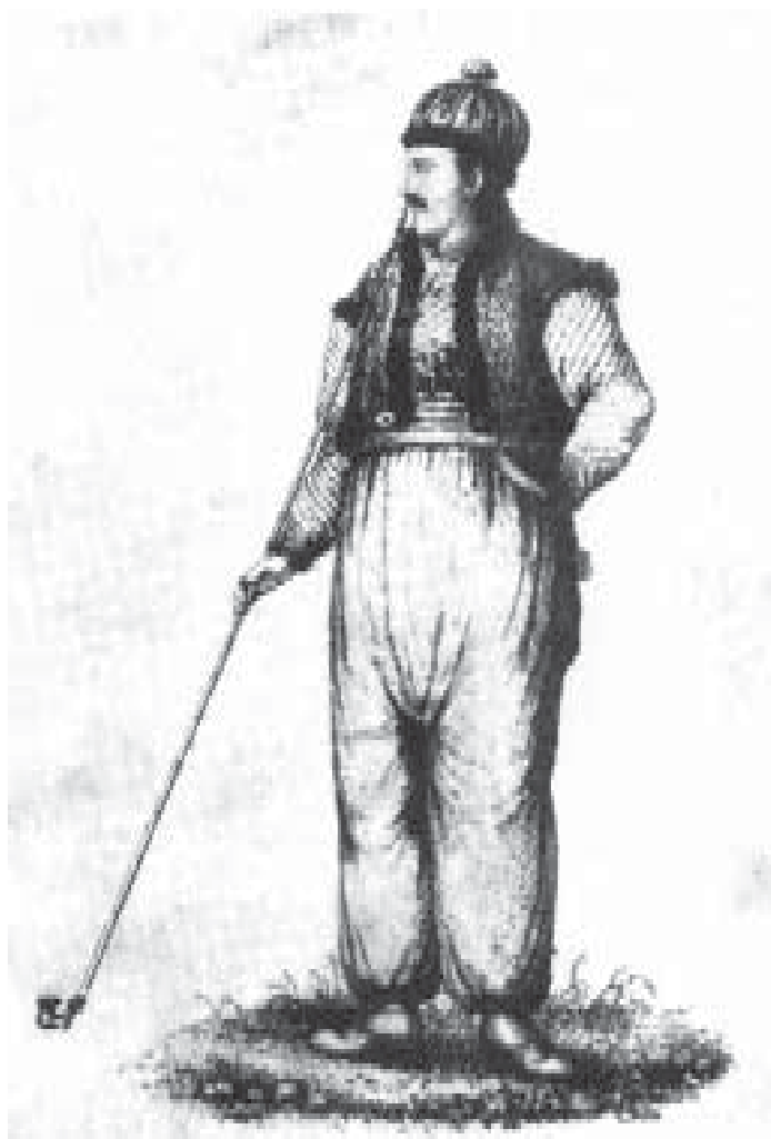
Миленко Стојковић, гравира Д. Н. Бантиша-Каменског (1808)