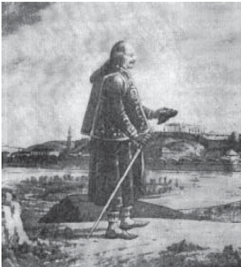
Младен Миловановић, акварел Ф. Јашкеа (1808)