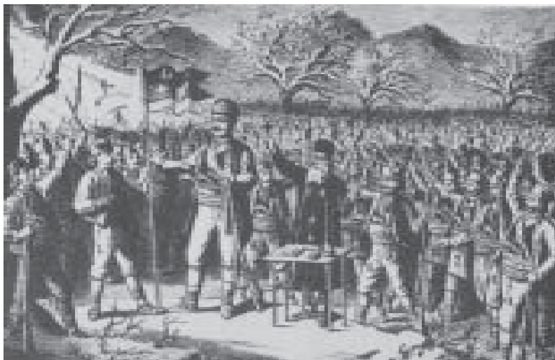
Збор у Орашцу

није вољан да се прихвати вођства, Карађорђе је одговорио да би непослушност, самовољу и хајдучију кажњавао смрћу. Сви се сложе да им треба тако строг „поглавица“. Атанасије је онда избор вође крунисао заклетвом, а завереници се стану примицати орашачком хану који се убрзо претворио у огањ. 588