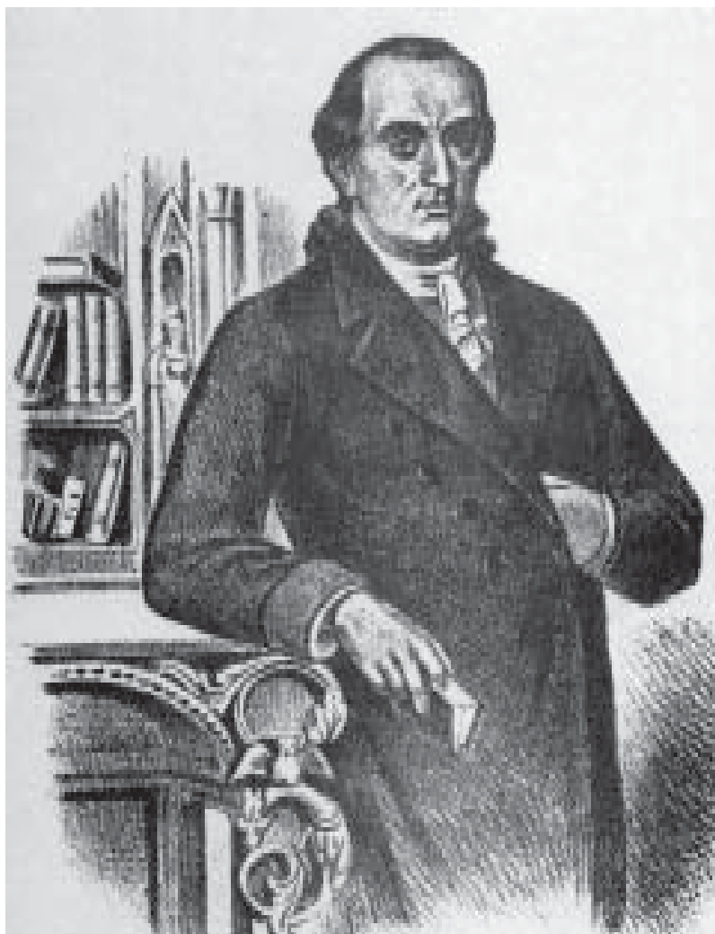
Доситеј Обрадовић, К. Ненадовић