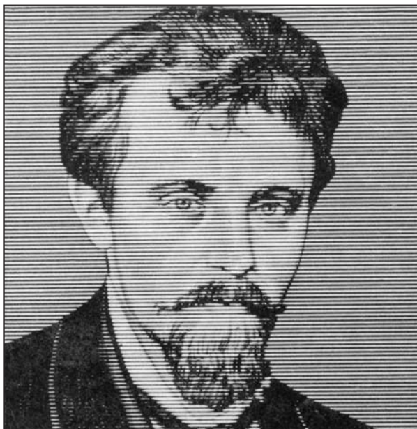
СЛИКА 1. Цртеж портрет др Лазе К. Лазаревића.

ник патријархалног морала (што му је Скерлић много пута замерао), поклоник једног прохујалог света са свим оним што је он носио у себи, од задржаног устројства до наивне вере у човекову доброту. Такве су биле његове приповетке „Школска икона“, „На бунару“, „Први пут с оцем на јутрење“, која је штампана 1894. године и у Шуши, у Монголији (Слика 2). Лазаревић је, међутим, био и бунтовник и немилосрдни критичар корумпираног грађанског друштва у коме су и онда ратни профитери водили главну реч у име патриотизма, захтевајући од народа сваку жртву, а при том незаинтересовани за даљу судбину жртвованих. У антологијској причи „Све ће то народ позлатити“ тај проблем је истакнут и описан таквом