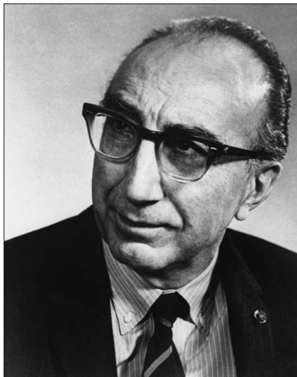
СЛИКА 2. Мајкл Дебејки FIGURE 2. Michael DeBakey