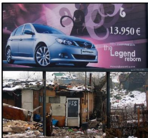
„Конвергенција 224“ – Наташа Станић