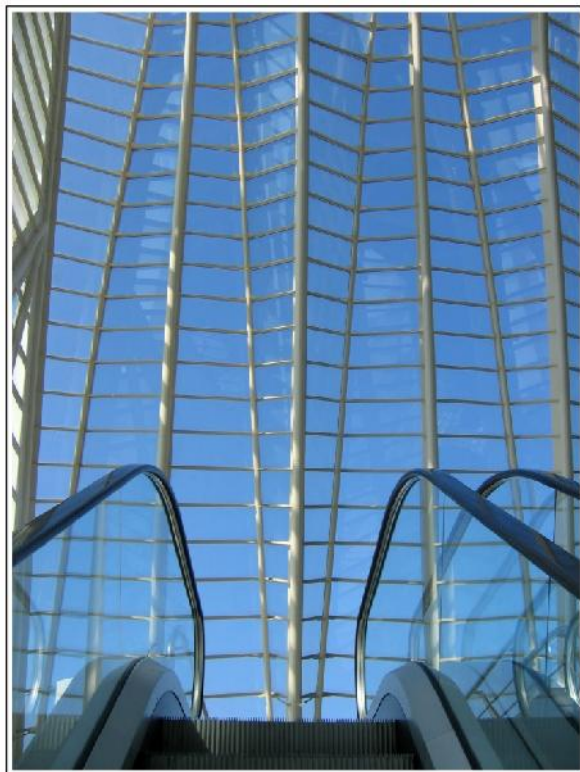
Наташа Станић: „Степенице ка небу“