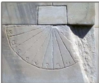
Милутин Тадић: Студеница