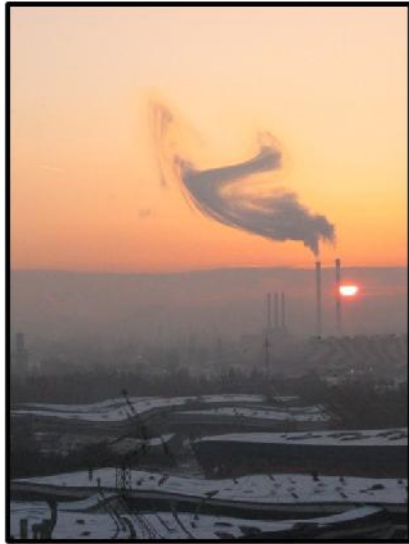
Наташа Станић: Тангента 72 А