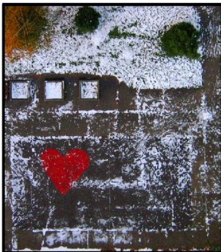
Наташа Станић: Нормала 64 С