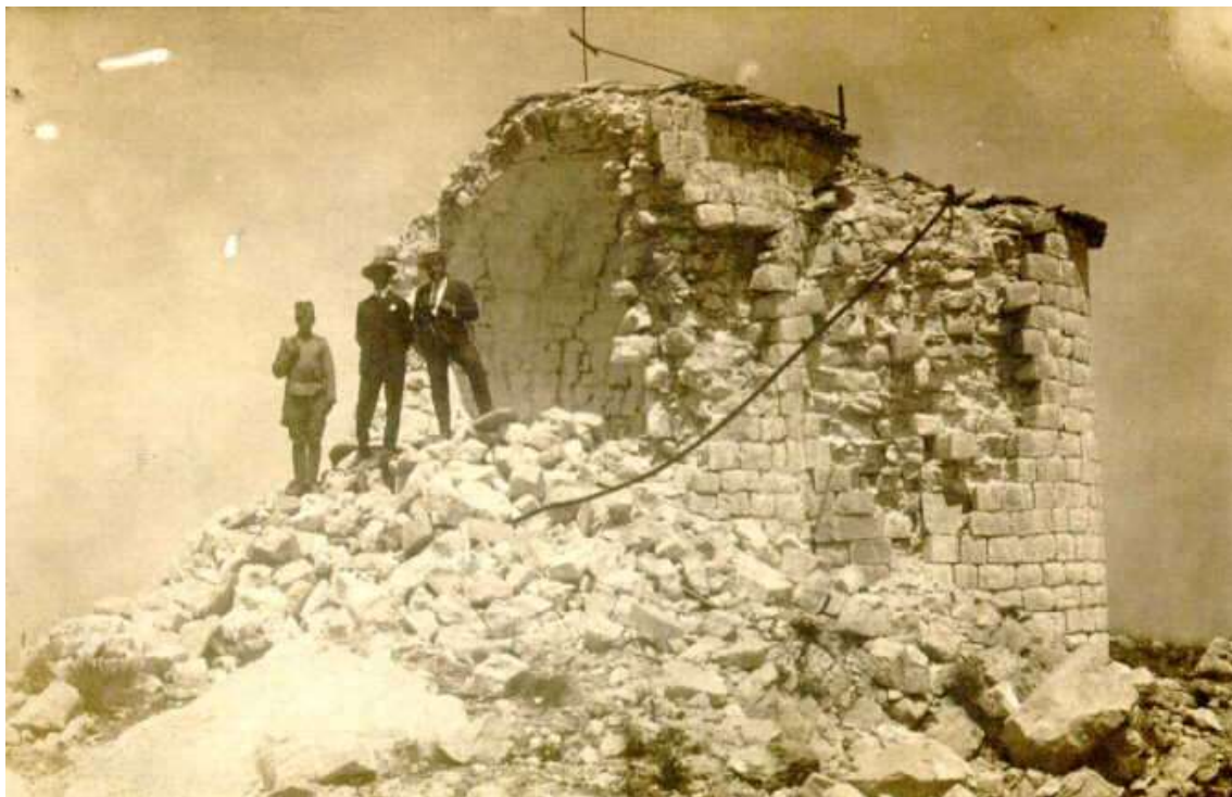
Рушевине првобитне капеле; снимак од 24. IX 1923, (фото: Н. Краснов).