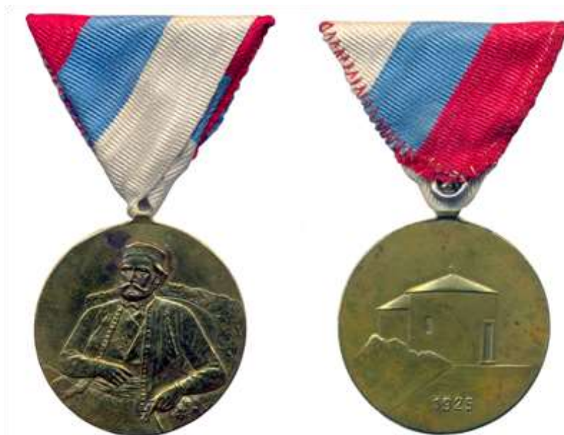
Његошева спомен-медаља, рад Ђорђа Јовановића, 1925.

( Политика , 20. I 2018, субота, бр. 37.425, год. CXIV, стр. 22, »100 година од Великог рата«, текст је скраћиван).