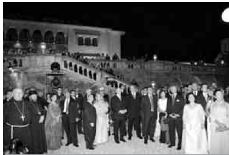
Рођенданска прослава окупила је 1200 угледних званица

Из доњег дела дворског парка гости су се, после пригодног уметничког програма, преместили у горњу башту где је служена свечана вечера. На огромној трпези сервирана су најразноврснија јела, а осим у мноштву интернационалних специјалитета, страни гости уживали су и у укусама српске кухиње.