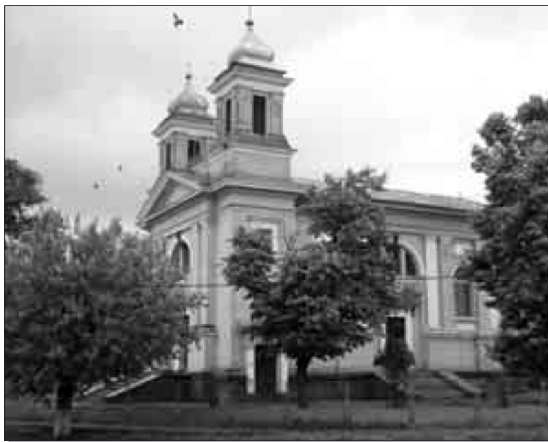
Српска православна црква у Фењу