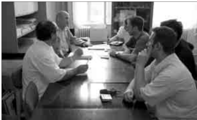
Конференција за штампу Јавне фондације за истраживање мањина

Самоуправа Жупаније Барање и Самоуправа града Печуја 1998. године заједнички су основале Јавну задужбину за истраживање мањина која има задатак да презентује историјске, етнографске, социолошке, демографске резултате, базиране на истраживањима о народностима у Жупанији Барањи.