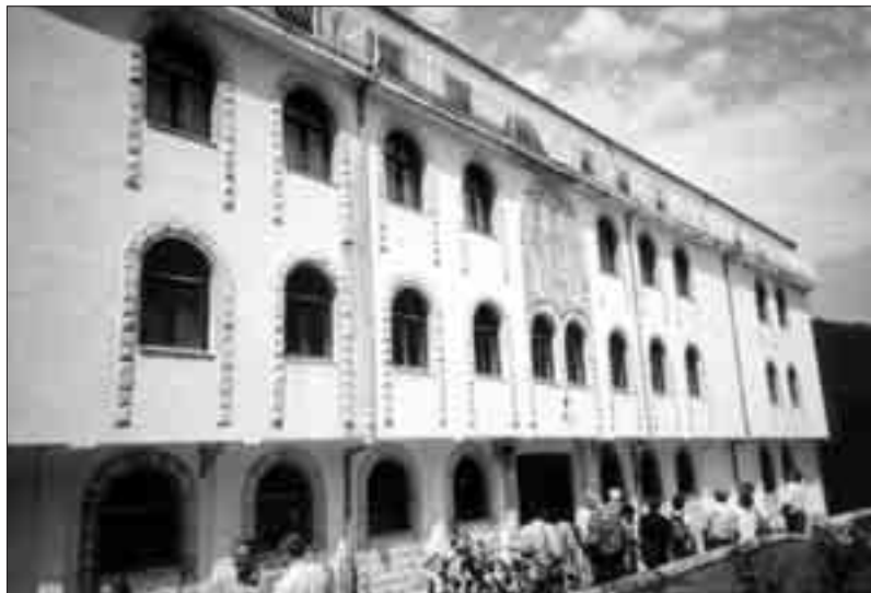
Манастир Три јерарха, Крка