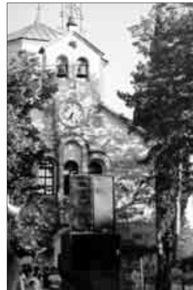
Црква у Кистању

је најављено. Иако према званичним подацима на подручју Книна данас живи 56% српског становништва, они у овом крају немају локалну власт, изгубили су тешко враћају на своја огњишта, а популацију чине углавном старија домаћинства.