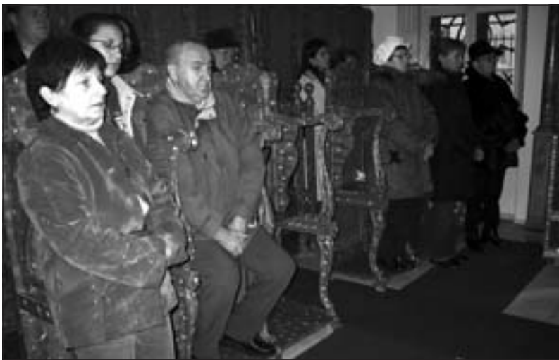
Божићна литургија у Печују