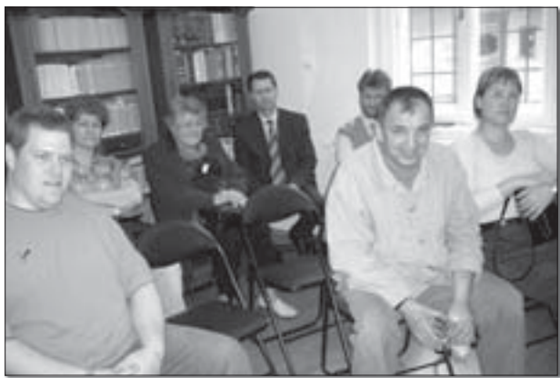
Публика на књижевној вечери