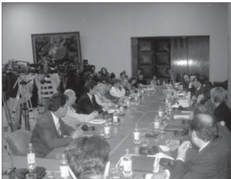
Учесници конференције у Палати федерације у Београду