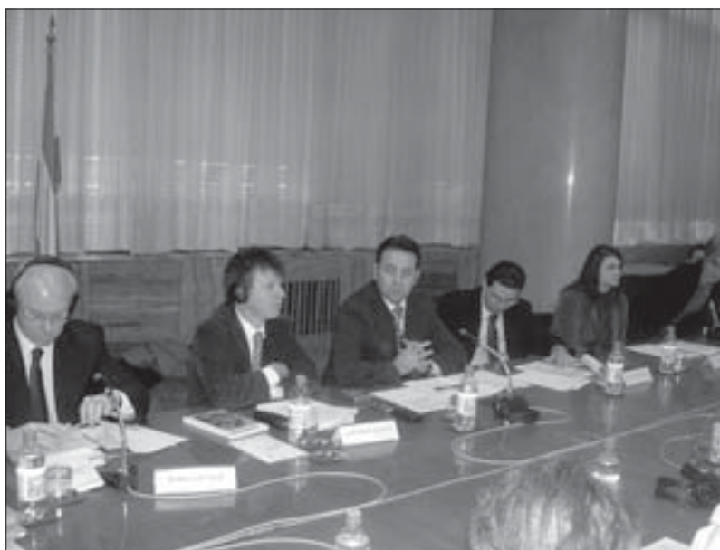
Расим Љајић (трећи с лева) на конференцији о мањинским језицима