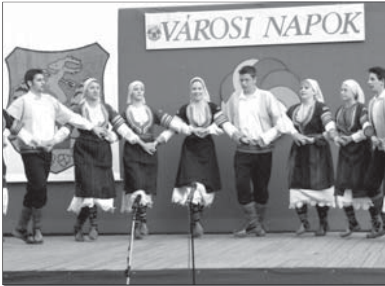
КУД Весели Сантовчани у Кишкерешу

А управо ове 2006. навршава се двадесет година од формирања и рада Културног удружења „Весели