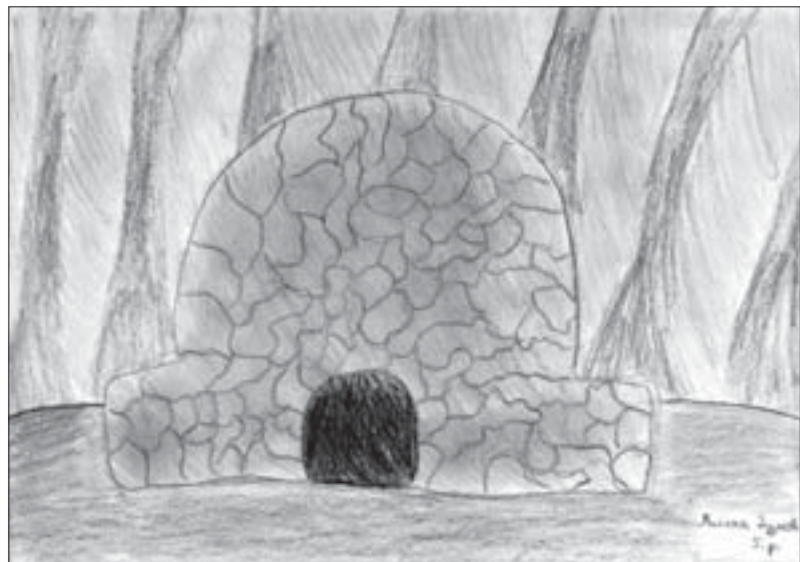
Кућа од камена, Милена Дујмов 5. разред