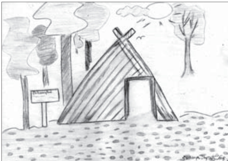
Колиба, Даница Чупић 6. разред