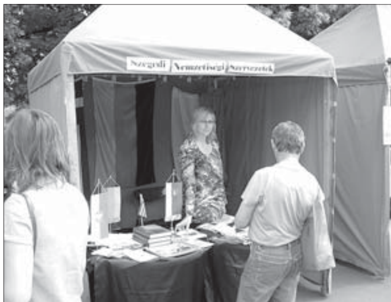
Једен од мањинских штандова на Данима Сегедина