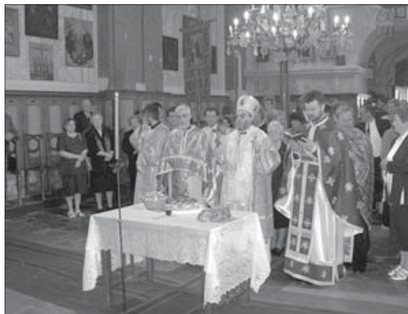
Света архијерејска литургија у сегединском српском храму

исказује своју оданост према Богу, Исусу Христу, Светосавској српској православној цркви.