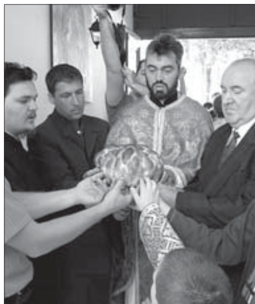
Окретање славског колача у Печују