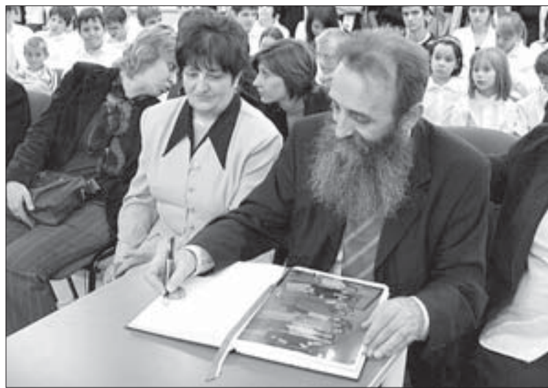
У књизи утисака остале су само речи хвале

међусобно сарађују и када за то не постоје формалне могућности.