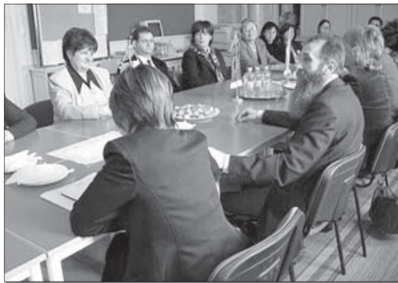
Високи гост међу члановима колектива СОШИГ

Објављен приручник за мањинске самоуправе