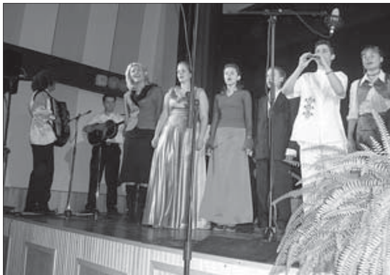
Бивши и садашњи ученици ОШ „Никола Вукићевић” из Сомбора