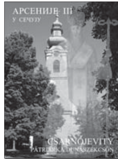
Насловна страна Барањских српских свезака