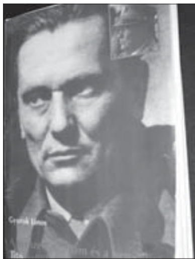
Омот књиге о Титу

Доживотни председник Југославије је у сваком случају „био довољно емпатичан и према Србима, и према Хрватима, и према Словенцима“ – речи су др-а Ивице Ђурока који је у својој књизи на 250 страница у 40 поглавља анализирао националну и мањинску политику Тита, маршала, признатог државника који је 35 година владао Југославијом ба-