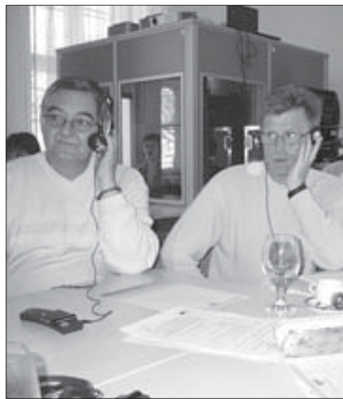
Део учесника усавршавања