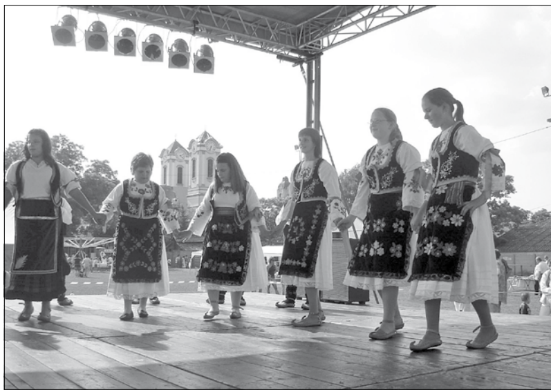
Наступ наше фолклорне групе у Батањи