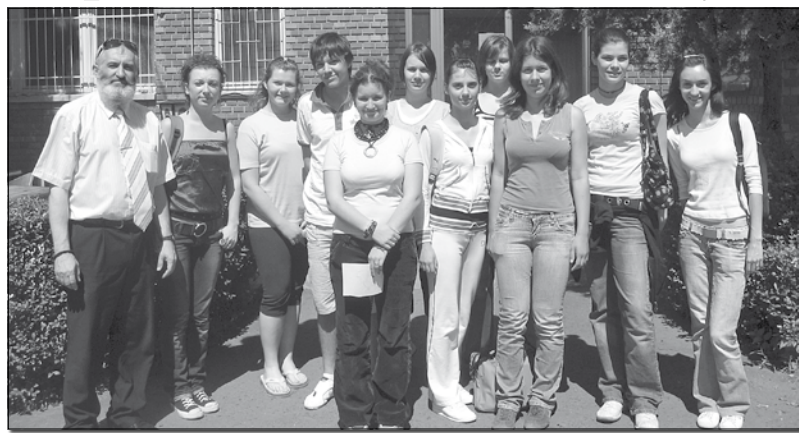
Ружа Магдолна са ученицима Српске гимназије

Договор је договор. Представница Мађарске на мајском „Евросонгу” у Хелсинкију, Ружа Магдолна, код претходног интервјуа за српски недељник замолила је сарадника СНН-а да јој пресними на ЦД српске песме – „Јесен стиже дуњу моја” и „Живот је један она бацила”, јер, пошто их много воли, намерава да их уврсти у свој други албум. У првом, „Ђурђевдан” је постао прави хит у Мађарској!