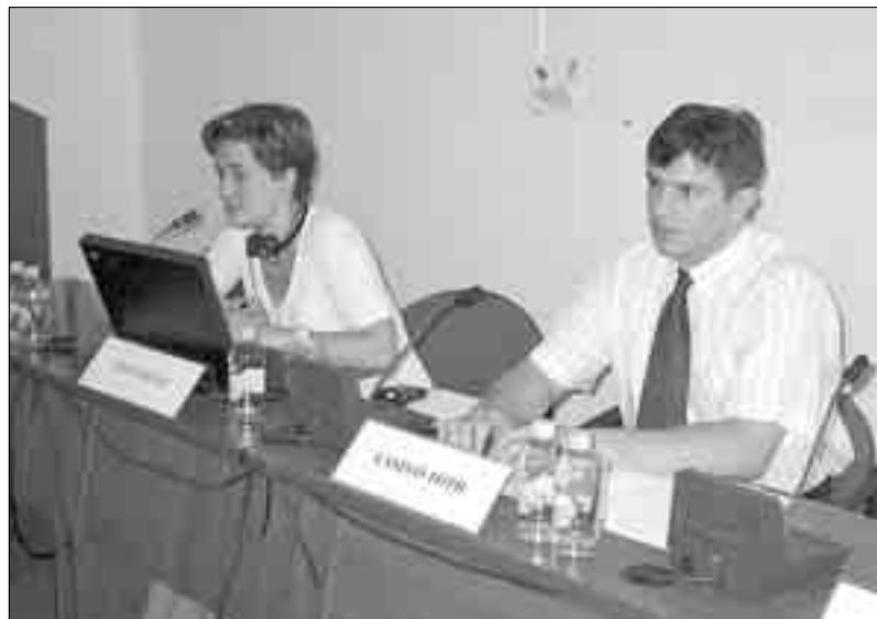
Предавачи на семинару у Сегедину

У организацији Центра за политичку безбедност, у Сегедину је од 11. до 15. јуна одржан петодневни међународни семинар о самоуправности, регионалној политици Европске уније и институционалним реформама.