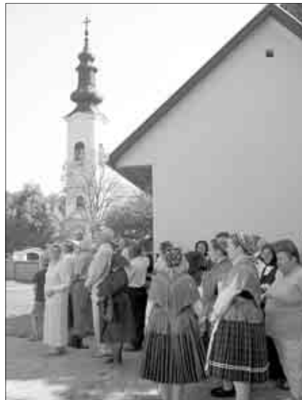
Посетиоци свечаности у Шумберку

Шумберчанка, иначе, матурант бундешгимназије Српске гимназије.