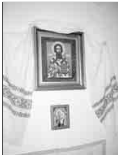
Детаљ из српске собе