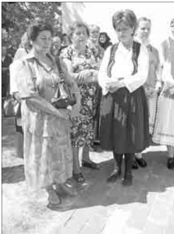
Пред етно-кућом чула се и Светосавска химна