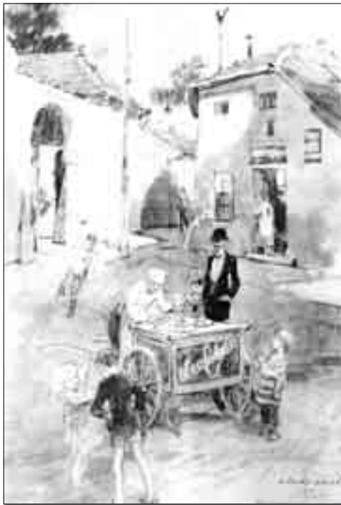
Ерне Зорад: Улица златног петла

први поглед препозна какартер. Увек је поступала инстинктивно. Умела је бити крајње шармантна, изазовна и заводнички урокљива. За то време вешто би осмотрила продавницу, а у себи нацртала прецизну мапу. У случају угојених продавачица, најчешће се поставила крајње безобразно и дрско. Већ при крају друге реченице, сусрет би се за тили час претворио у жестоку свађу. Затеченост беше њено основ-