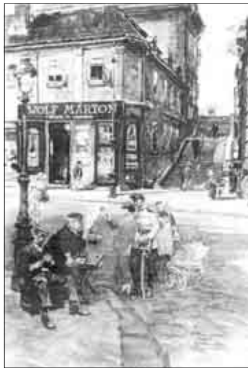
Ерне Зорад: Детаљ старог Табана

У крчми „Код златне руке” играле су се тихе али напете партије домина. Они који су се лаћали мађарских карата, тонули би у непрегледне битке логике и блефа. Обожаваоци домина играли су у шприцере и беху потпуно безазлени. Међутим, карташи су играли у новац. А то је знало бити крајње опасно. У њиховом случају страст је често умела да надвлада разум. Тако су многи до поноћи остајали без иједног бакреног новчића и очајни се дизали од стола. Али то нису били прави играчи. Професионалци су навраћали касно у ноћ. Никада пре