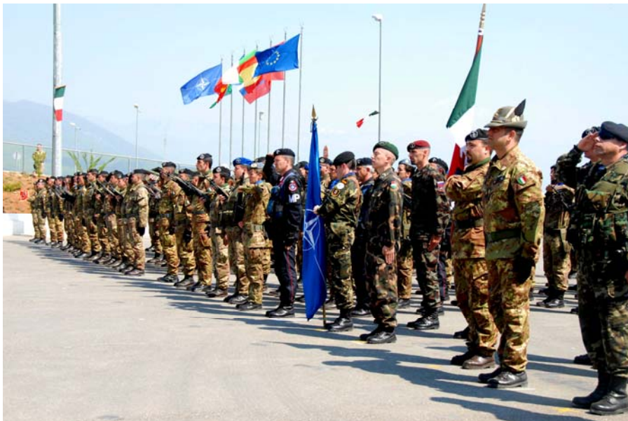
Трупе УН ће остати на Косову и Метохији и после одређивања статуса

И поред доследности оваквог приступа, српска преговарачка страна допушта отворену дискусију и одређену промену свог става о овом питању, посебно када је реч о директном