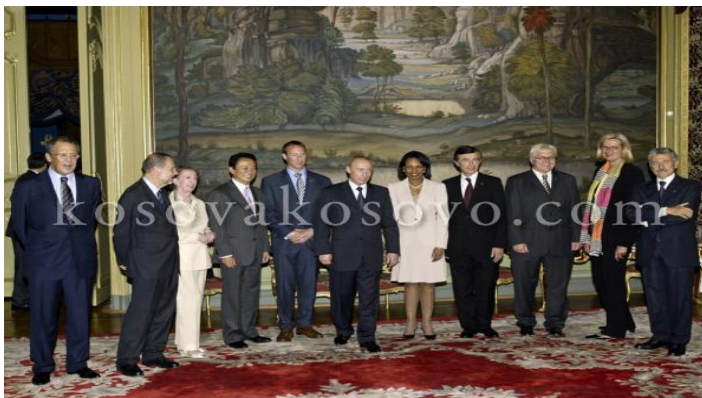
Министри спољних послова земаља чланица Контакт групе

Приштина — Представници земаља чланица Контакт групе састаће се 15. октобра у Бриселу, дан после директног сусрета делегација Приштине и Београда, а на том састанку учествоваће и посредничка „тројка”, преноси приштински дневник „Зери”. Према дипломатским изворима, на које се лист позива, министри спољних