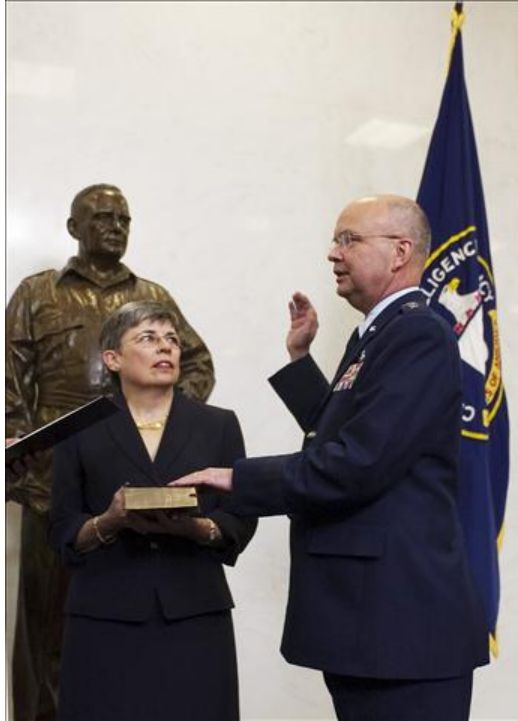
Заклетва генерала Хајдена, директора ЦИА

Како је на Западу већ више пута речено „да око Косова не могу једни добити све, а други изгубити све“, односно „да резултат не може бити десет према нула, већ евентуално шест према пет“ (речено после најновијег разговора између председника Србије и председника Чешке), хајде да претпоставимо да тих „пет“ за Србију није само чување манастира и безбедност деце која иду у школе.