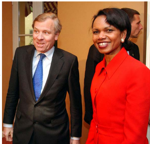
Јап де Хоп Схефер и Кондолиза Рајс

Схефер је, на конференцији за штампу после разговора с македонским председником Бранком Црвенковским, нагласио да Атлантски савез подржава преговоре о Косову уз посредништво тројке Контакт-групе.