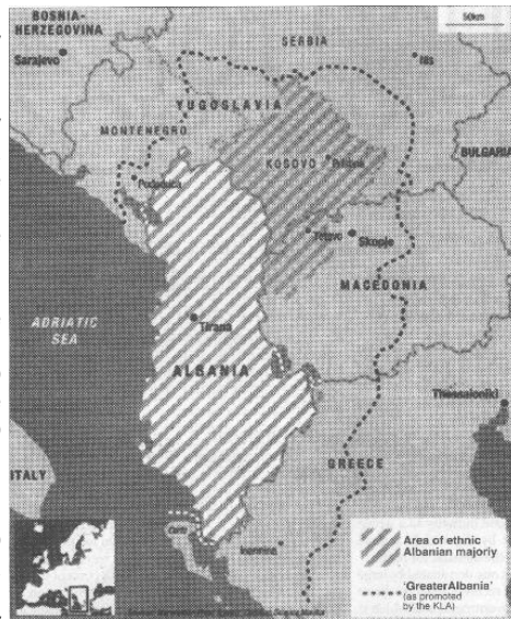
Велика Албанија Да ли се може спречити?