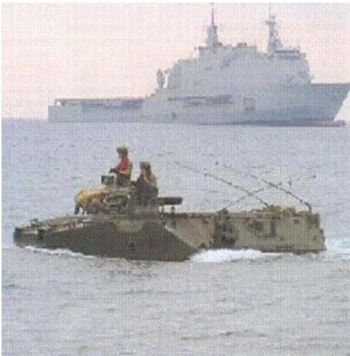
НАТО снаге за одговор морају да буду спремне за глобалне интервенције - искрцавање експедиционих снага у Турској

„Уколико Русија настави да се противи плану УН, Вашингтон и његови савезници морају кренути напред и признати Косово на крају рока 10. децембра... Јасно се мора ставити до знања Београду да може много да добије, укључујући потенцијално чланство у ЕУ и НАТО, уколико се томе не буде противио сувише гласно или деструктивно“, навео је „Њујорк тајмс“.