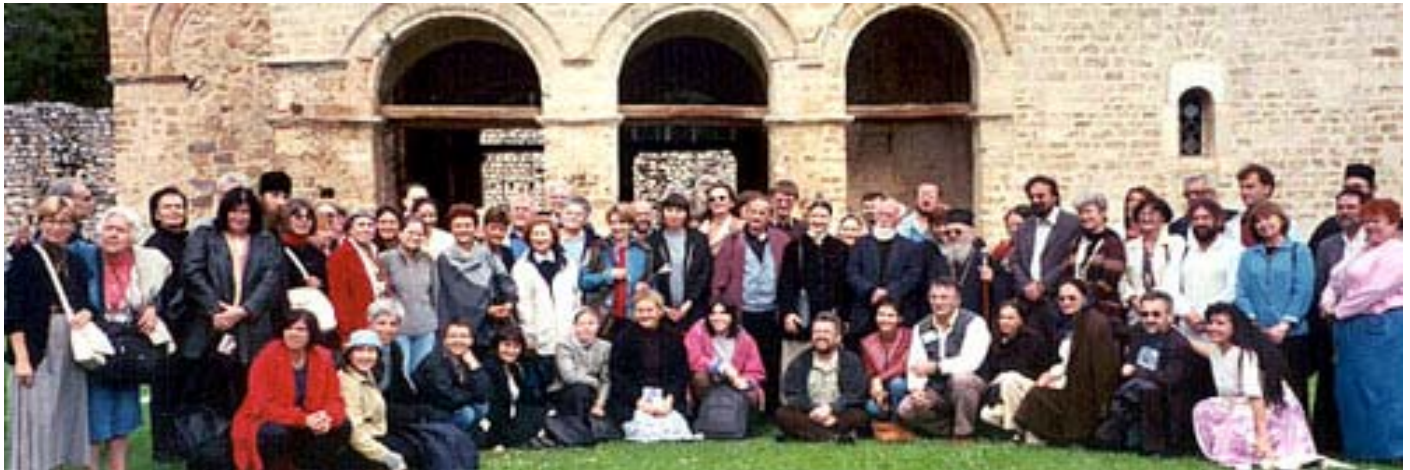
Учесници Међународне конференције о Хиландару одржане у Рашкој 2002.

У Светоме Писму је указано шта треба радити и како живети да бисмо имали наду на спасење. Наравно, постоје неки хришћани који уче да ми ништа не можемо учинити за своје спасење, јер то је дар Божији. Кажу и то да се дела не рачунају јер се само вером спасава. Није тако, али о томе нећу сада и овде. Уместо тога навешћу нешто из светогорских и светоотачких разговора и учења. Један млади монах је разговарао са својим старцем, духовним оцем о спасењу. Жалио се да је свет у коме живе тако покварен да се пита како ће се људи тога нараштаја спасти када је свет тако изопачен. Онај који после настаје биће још гори, - одговорио му је старац. Па како ће се онда људи уопште спасти, питао је монах. Самим тим што ће живети у таквом свету, одговорио му је старац. Морам да се запитам да ли ћемо се и ми спасти самим тим што и ми живимо у једном страшно изопаченом свету.