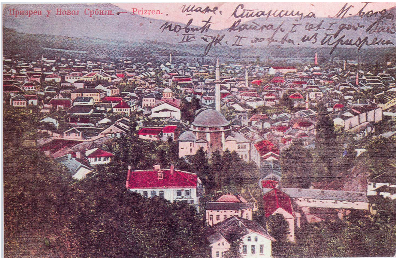
Призрен 1913. године

је много и табака и терзија. Призренски се сахијан извозио у Маџарску, други се призренски производи извозили на све стране, нарочито у Мисир и Србију. Трговина је сва била у рукама хришћана. Али је тада већ друм скадарски постао несигуран и рђав, да се Призрен почео окретати Солуну, одакле је добивао енглеску робу. Мекензијева и Ирбијева не смањују Призрену број становништва, али тврде, разуме се погрешно, да је „сасвим без икакве политичке и трговинске важности“. Важну статистику Призрена пружа поуздани Милер у својој Арбанији (1844). Он рачуна да у Призрену има 6 000 кућа, од којих су 4/5 Срба и сматра Призрен као једну од најкраснијих, најбогатијих и најрадних вароши у Турској.