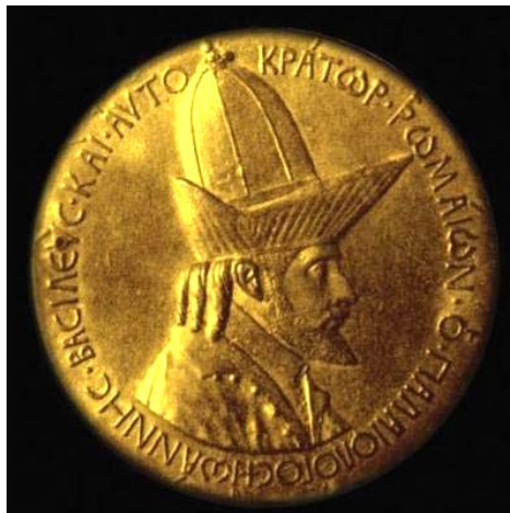
Цар Јован VIII Палеолог

Сабор је протицао у напетост атмосфери у којој су узвишену и мирну расправу, каква би доликовала таквом скупу, замениле бескрајне и мушчаве препирке. Као доказни материјал често су изношена и позивања на недопустиво мали и тенденциозно изабрани број рукописа светих отаца и учитеља цркве, а недовољно познавање латинског код Византинца и грчког међу Латинима додатно су отежавали споразумевање. Нису биле ретке ни ружне сцене кад је неким учесницима било забрањено да изнесу своје ставове. Како је сабор протицао, видело се да