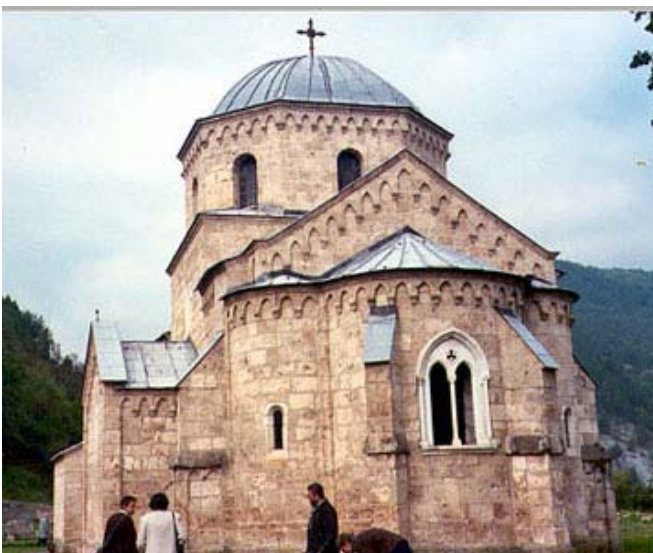
Манастир Градац—задужбина Краљице Јелене Анжујске