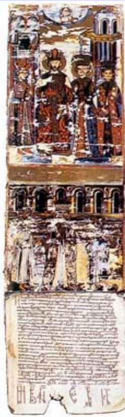
Повеља деспота Ђурађа манстиру Есфијмен на Светој Гори