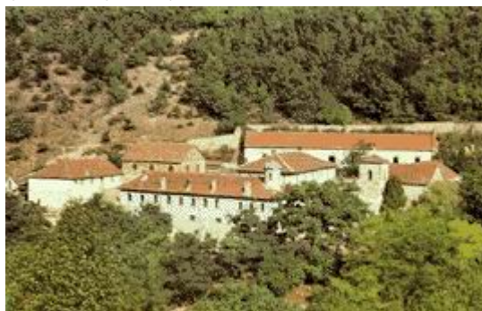
Манастир Девич—задужбина деспота Ђурађа Бранковића

Ђурађ се родио око 1375. године, као други син косовског господара Вука Бранковића и Маре Лазаревић, кћери кнеза Лазара. „Тада је био наилазак иноплеменика на хришћане“ (Стеф. Лазаревић). Мрачни облаци надвијали су се над Србијом након пораза на Марици 1371. године. У једној генерацији малоазијски Турци претворили су се од номадских ратника, који су дуго били тек најамници балканских великаша, у немилосрдне освајаче Балкана. Ђурађ је био дечак оног Видовдана 1389. године кад му се отац вратио с поља Косова јављајући о крвавој бици у којој су погинули кнез Лазар, Милош и толики други. „Не поштедисмо живот наш, да живописан пример после овога другима будемо.“ Да ли је Вук био крив само зато што он и његови ратници нису остали до краја и нису до последњег изгинули? Или је ипак напустио кнеза пре времена? То никада нећемо сазнати. Али, знамо да је (историјски) Вук Бранковић и након Косова наставио отпор