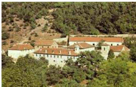
Манастир Девич—задужбина деспота Ђурађа Бранковића

Ђурађ се родио око 1375. године, као други син косовског господара Вука Бранковића и Маре Лазаревић, кћери кнеза Лазара. „Тада је био наилазак иноплеменика на хришћане” (Стеф. Лазаревић). Мрачни облаци надвијали су се над Србијом након пораза на Марици 1371. године. У једној генерацији малоазијски Турци претворили су се од номадских ратника, који су дуго били тек најамници балканских великаша, у немилосрдне освајаче Балкана. Ђурађ је био дечак оног Видовдана 1389. године кад му се отац вратио с поља Косова јављајући о крвавој бици у којој су погинули кнез Лазар, Милош и толики други. „Не поштедисмо живот наш, да живописан пример после овога другима будемо.” Да ли је Вук био крив само зато што он и његови ратници нису остали до краја и нису до последњег изгинули? Или је ипак напустио кнеза пре времена? То никада нећемо сазнати. Али, знамо да је (историјски) Вук Бранковић и након Косова наставио отпор