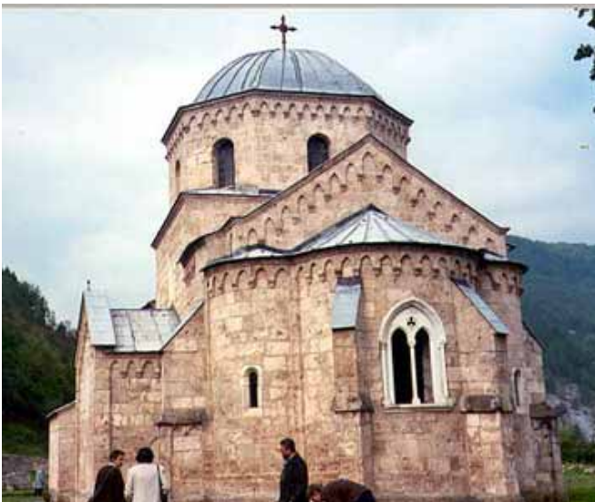
Манастир Градац—задужбина Краљице Јелене Анжујске