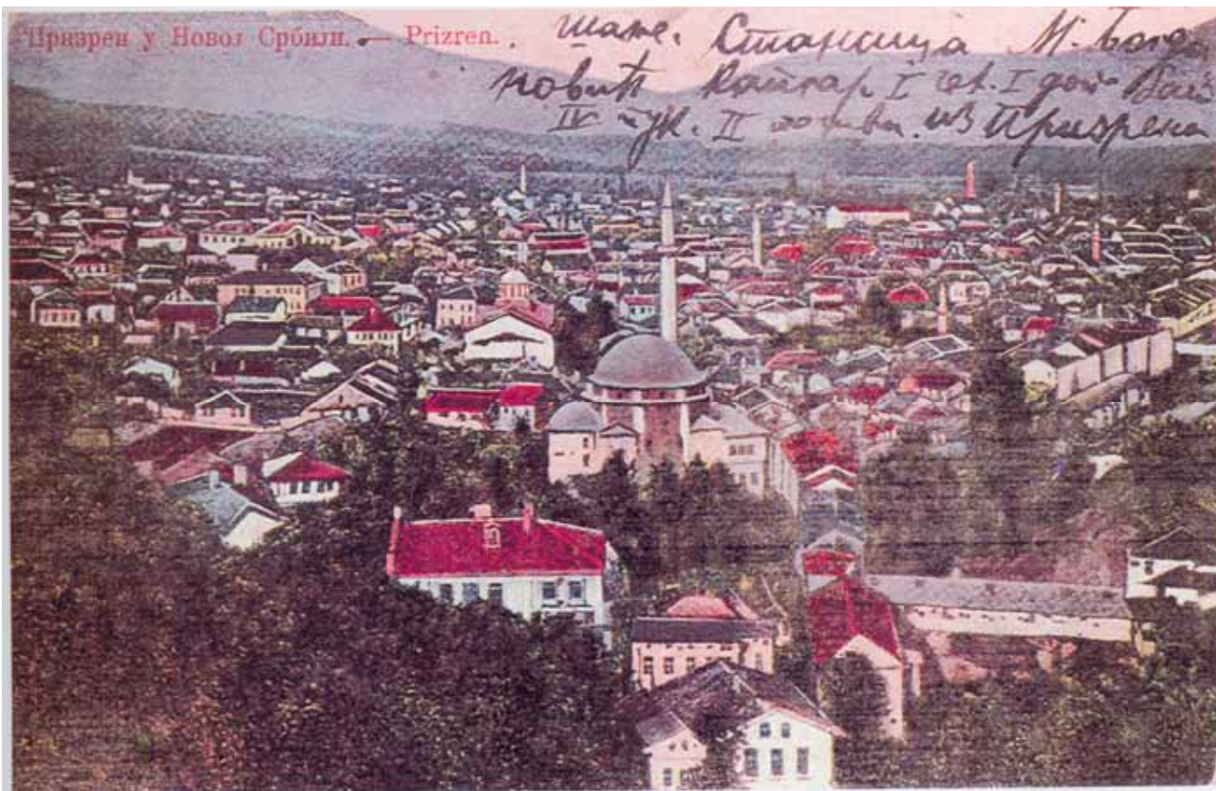
Призрен 1913. године

је много и табака и терзија. Призренски се сахијан извозио у Маџарску, други се призренски производи извозили на све стране, нарочито у Мисир и Србију. Трговина је сва била у рукама хришћана. Али је тада већ друм скадарски постао несигуран и рђав, да се Призрен почео окретати Солуну, одакле је добивао енглеску робу. Мекензијева и Ирбијева не смањују Призрену број становништва, али тврде, разуме се погрешно, да је „сасвим без икакве политичке и трговинске важности“. Важну статистику Призрена пружа поуздани Милер у својој Арбанији (1844). Он рачуна да у Призрену има 6 000 кућа, од којих су 4/5 Срба и сматра Призрен као једну од најкраснијих, најбогатијих и најрадних вароши у Турској.