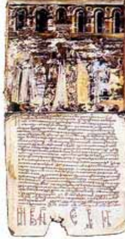
Повеља деспота Ђурађа манстиру Есфијмен на Светој Гори