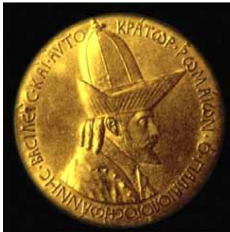
Цар Јован VIII Палеолог

Сабор је протицао у напетост атмосфери у којој су узвишену и мирну расправу, каква би доликовала таквом скупу, замениле бескрајне и мушчаве препирке. Као доказни материјал често су изношена и позивања на недопустиво мали и тенденциозно изабрани број рукописа светих отаца и учитеља цркве, а недовољно познавање латинског код Византинца и грчког међу Латинима додатно су отежавали споразумевање. Нису биле ретке ни ружне сцене кад је неким учесницима било забрањено да изнесу своје ставове. Како је сабор протицао, видело се да