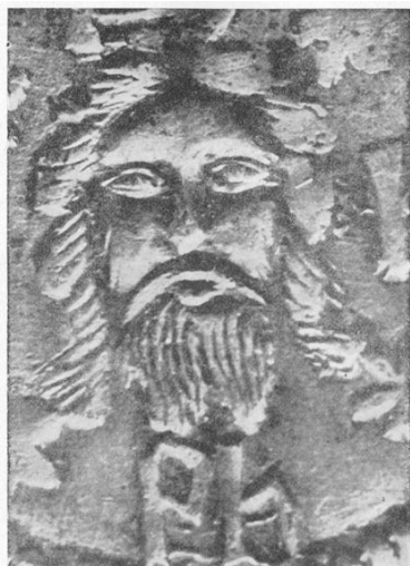
Сл. 1. Деспот Ђурађ (лик с његовог новца)

У претешким временима деспот Ђурађ Бранковић борио се с неупоредивом упорношћу и снагом за сваки педаљ српске земље и за последњи одсјај слободе. Турци су му убили оца и брата, ослепили два сина, одвели кћерку у харем, отели очевину, понижавали и газили домовину. Повремено је био њихов вазал, а повремено највећи непријатељ. Ипак, никада, ни под старе дане, није се предао нити посустајао. Кад су му Мађари одузели Београд, саградио је нову престоницу; кад су му Турци заузели готово целу Србију, отишао је у Зету да се бори; кад су му ослепили два сина, он је трећег, најмлађег, свечано прогласио за наследника; веома богат, пристајао је да уложи и последњи златник и имање како би окупио савезнике и још једну војску за Србију. Био је један од ретких владара који је у борби с Турцима изгубио државу да би је, после више година борбе, поново обновио. Знао је да буде одлучан, али и да се покори и поклони кад му ништа друго није преостајало. Знао је да се свети, али и да пређе преко увреда ако је то било неопходно. Живео је дуже него било који од наших средњовековних владара, осим Стефана Немање. Више окретан политичар и дипломата него ратник, стално је тражио савезе и начине да постигне свој циљ. Међутим, ни у најтеже време није се одрицао онога што је сматрао за најдрагоценије