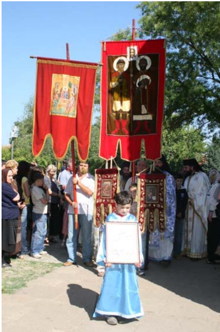
Литија око храма

Само одважни и храбри пастири и слуге Божије су и онда, као и