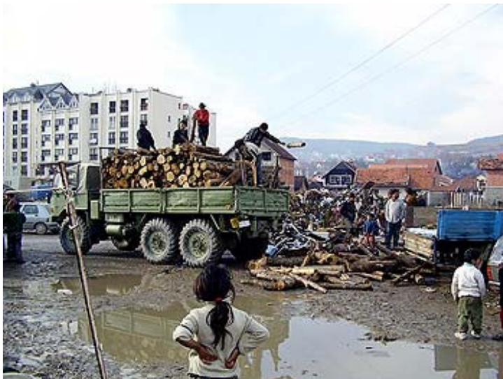
Роми у колективном центру у Новом Пазару

су ти пописани људи, ко их је пребројавао и када? Да ли они још негде постоје, или живе само на различитим списковима? Да ли су те породице заиста кренуле од Косова, па се задесиле у некој од чланица ЕУ, а сада је све у реду, вратили су се и волонтирају на неким од ових пројеката, збринуте од својих интегрисаних сународника и других заштитника?