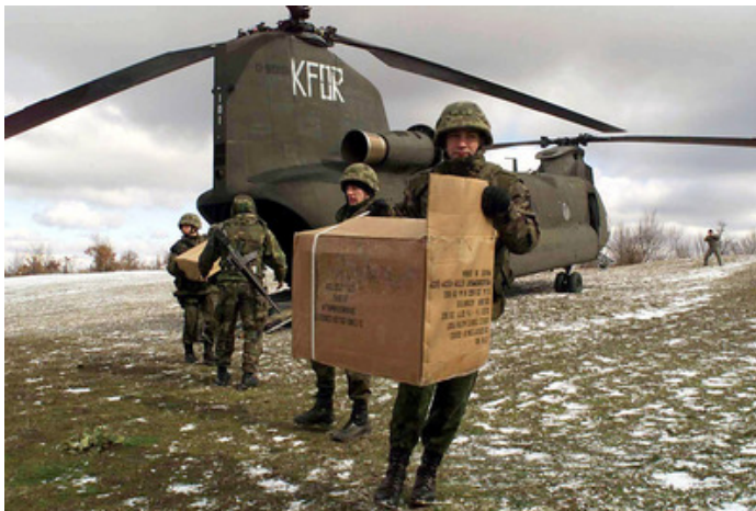
Пољски, украјински и амерички војници на Косову 2001 код села Дренова Глава

У датој ситуацији, више је него природно што су украјинске власти помислиле да, после толиког заоштравања односа са дојучерашњим патронима, једини спас могу наћи у што хитнијој, чвршћој