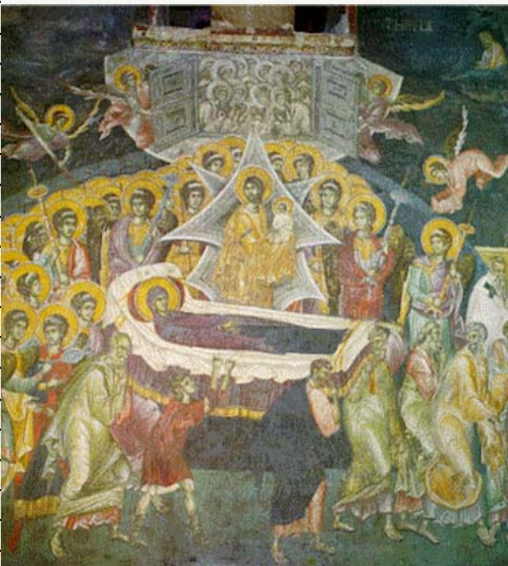
Грачаница - Успење Пресвете Богородице (1321)

Гледам добро познате пределе и не препознајем их... Погледом тражим куће и имања својих пријатеља, бранике. Тражим крај пута шуму, стабала правих као стрела, а дебелих да их човек не може рукама обгрлити.... Узалудно је моје тражење. Куће су зарасле у зидине силеџијства и