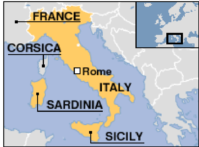
Неке од неуралгичних тачака Француске и Италије

Ишингер се нада да би примена сличног модела који су две