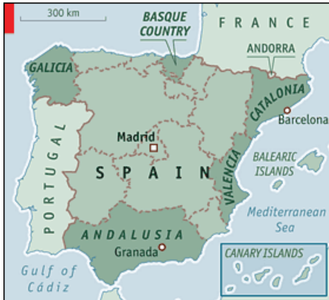
Шпански центрифугални региони

Недавно је сличан сценарио изнео новинар Тим Џуда гостујући у дебати на приштинској телевизији. По њему, у случају да Београд и Приштина не постигну споразум, могућа је примена Ахтисаријевог плана. „Тројка“ тада може рећи странама да Ахтисаријева план у ствари не помиње реч независност, већ само пропратно