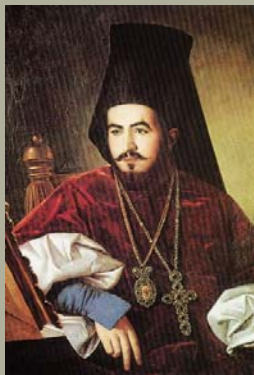
Петар Петровић Његош

Одлучили смо да Велику Госпојину прославимо заједно са нашим мученичким и страдалним народом у Грачаници. У мислима смо са њима стално, али желимо да данас и телом и душом будемо заједно. Они су у сталној животној опасности, стално изложени терору и насиљу, у сталној и грчевитој борби за биолошки опстанак. Идемо да не буду сами. Да знају да има много оних који осећају њихову патњу и желе да је поделе с њима... И после прогона и погрома шиптарских терориста преостали народ има