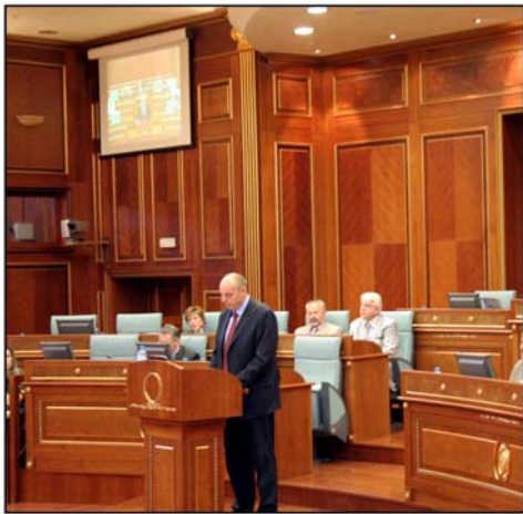
Премијер Агим Чеку

јучерашње седнице Скупштине Косова новинарима изјавио да ће косовска страна тражити од међународне заједнице да примедбе Приштине ују у предложени документ.