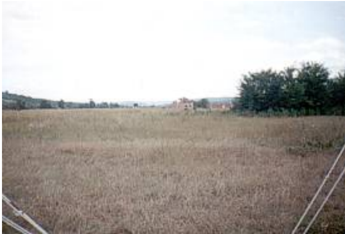
»Чудесна долина« Осојане: Део пустих поља

Смањена слобода кретања отежава приступ установама за коришћење јавних услуга у области заштите здравља, обра-