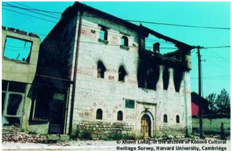
Албанска кула на Косову

Са друге стране, ако добијемо гаранције, као што је описано у документу о замрзавању процеса, по ком ће се одржати референдум 5. јануара 2020, по ком ће Косово имати свеж прилив долара за развој, све ће бити разјашњено до 2020. и са нас ће се уклонити страх, и по ком (документу) ћемо се развијени припремити за улазак у Европу, не видим разлог зашто се ова