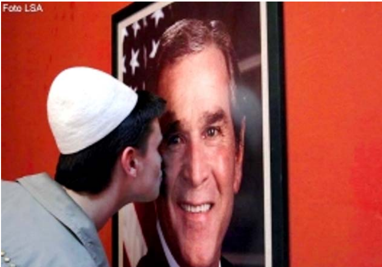
Америка - највећа албанска узданица

Бивши фински председник, Марти Ахтисари 18 месеци је вршио