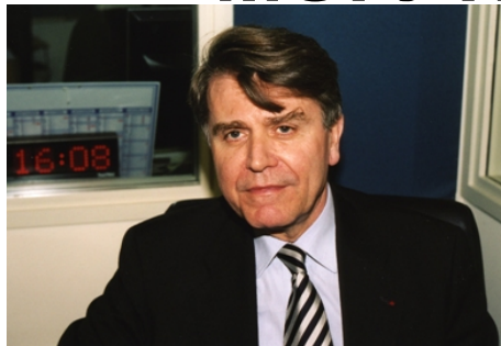
Тјери де Монбријал

Решавање косовског проблема трајаће годинама, а модел прихватљив за све стране могуће је наћи у оквиру Европске уније, каже овај угледни аналитичар.