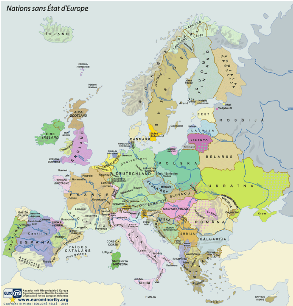
Мапа европских нација без државе

самоопредељење народа који су данас без сопствене државе“ највећу групу чине немачки парламентарци, пре свега „зелени“, тринаест од 42 припадника ЕФА стижу из Немачке а један од копредседника је Јошка Фишер, бивши немачки министар спољне политике. И један од потпредседника је Немац, као и два генерална секретара ЕФА-е. Чланство из Немачке држи и најважније позиције у комитетима за тржиште, спољну политику, безбедносну и одбрамбену политику.