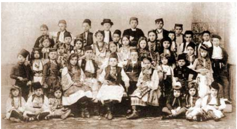
Српска деца са Косова и Метохије - слика из 19. века

У међувремену је дошло и до обнове дела стамбених објеката и