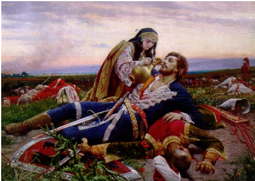
Урош Предић - Косовка девојка