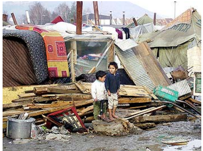
Деца из колективног центра

укључе у велику стратегију за сузбијање сиромаштва. Да виде како је боље када се поштеним, физичким радом зарађује долар