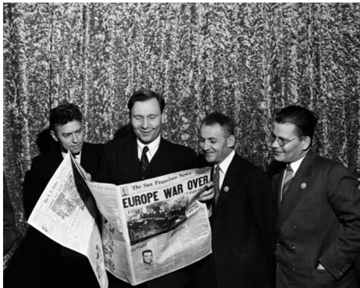
Крај рата 1945—Руска делегација у УН

http://pravda.ru/world/europe/balkans/20-07-2007/232529-kosovo-0