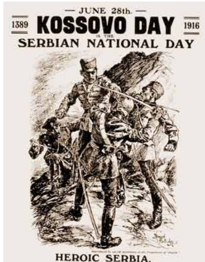
Видовдан 1916 - Енглески постер који приказује српског војника који се бори са Немцем, Аустријанцем и Бугариним

Део пољопривредника не може да наступи својом робом на градским пијацама које су им пре рата 1999. године биле доступне.