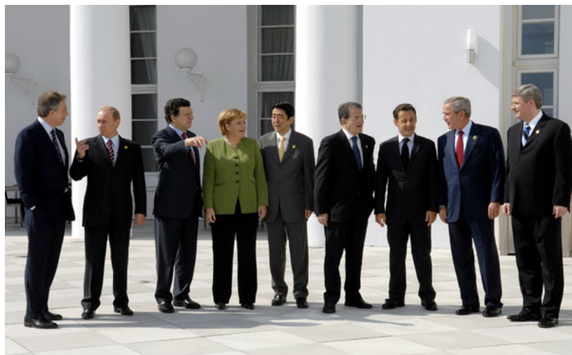
Г8 - Како до заједничког језика у вези са КиМ

Други испит је безбедносна политика. Страх од домино ефекта, најпре у балканском региону, отвара питање да ли је ЕУ војно способна и спремна да одржи стабилност у региону. ЕУ је пре-