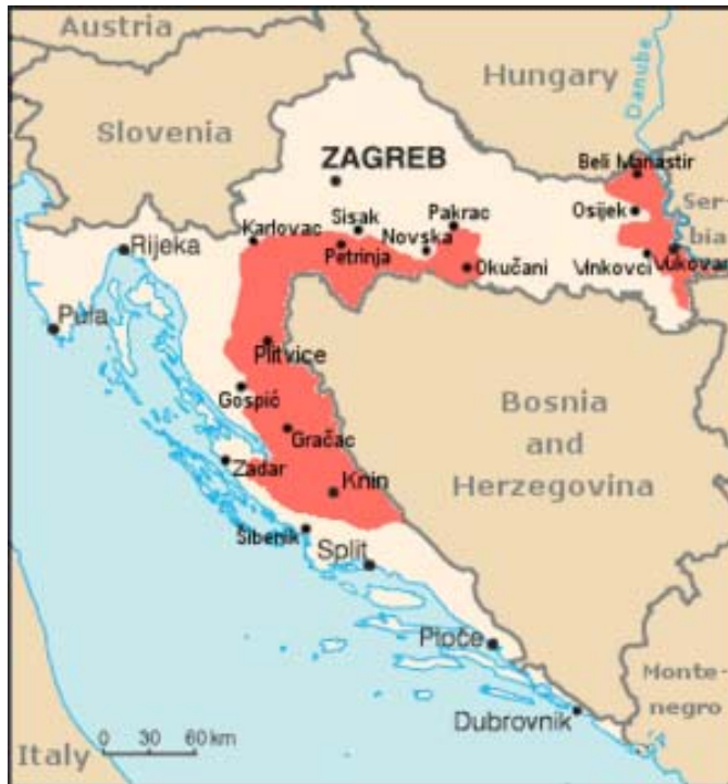
Граница Републике Српске Крајине

(НДХ), као коалициони партнер Хитлера, побила у својим логорима више од милион људи, пре свега Срба, Јевреја и Рома. Први председник те Хрватске од 1991. године је, према медијским извештајима, био у добрим и пријатељским односима