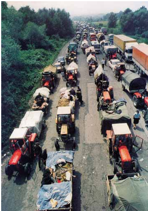
Егзодус Срба 1995. године

Ако је већ реч о праву у вези са тим, отвара се легитимно питање: да ли је право на изгра-