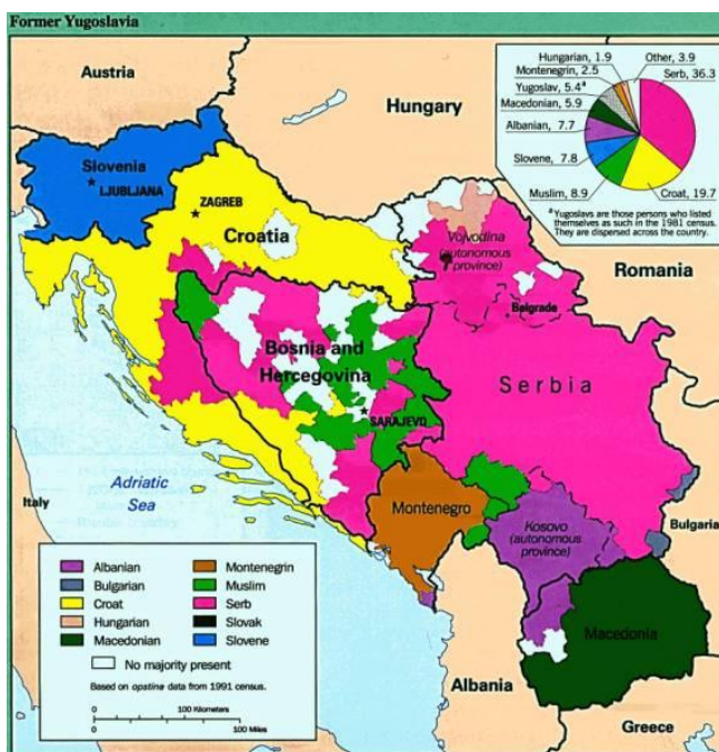
Етничка мапа Југославије

(Владан Станковић, Институт за политичке студије, Београд)