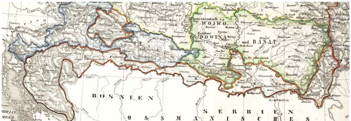
Аустријска Militärgrenze - Војна граница према Турској царевини

Претпоставимо, најзад, да Израел као држава Јевреја своје сународнике почне да помаже у новцу, храни и лековима.