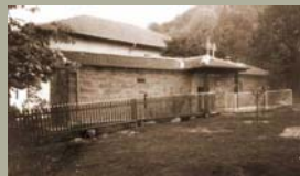
Црква манастира Соколица посвећена Покрову пресвете Богородице

Гласник Косова и Метохије—ПРЕГЛЕД излази петнаестодневно и доноси преглед најинтересантнијих дужих чланака, репортажа, разговора... у вези са КиМ и шире