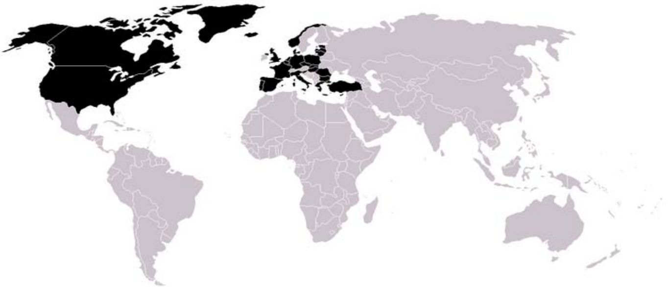
НАТО чланице (затамњено) - NATO members (darkened)

The standard response to the arguments against NATO's eastward expansion was that Russia's neighbors felt unsafe. However, with the Cold War over and a democratic political regime in Moscow, Russia clearly posed no military threat either to the Poles, Czechs or Hungarians. Neither Warsaw nor Prague could point to any signs that Russia had aggressive designs towards Eastern Europe.