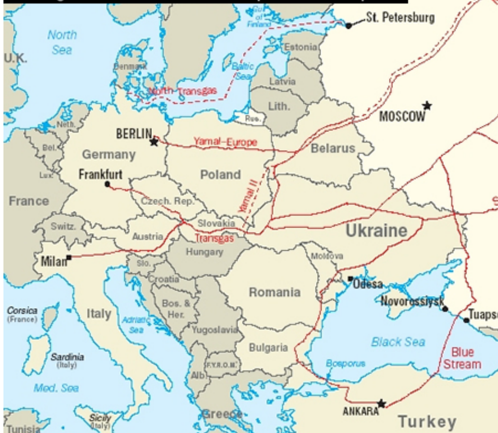
Постојећи и планирани гасоводи за Европу

Да би се осликало комплетно стање руске привреде и друштва на крају прошлог века били би потребни читави томови књига и анализа. Међутим, и обичном лаику је било јасно да је стање у Русији тих година било на ивици националне катастрофе и потпуног државног краха. Сврха једног оваквог рада није тако претенциозна, у смислу детаљне анализе таквог стања, већ напросто његова констатација, а све у циљу давања одговора на конкретне перспективе односа између Русије и Србије за будућност.