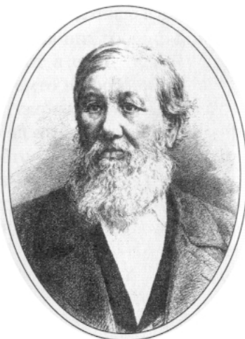
Николај Ј. Данилевски

У наредним деценијама пред Русима је решавање једног од најтежих проблема: судбина домаће глобалистичке елите која је приврженија економском дарвинизму него шведском социјализму. Новопечени богаташи опчињени су инстинктима задовољства на путу доколичарске демобилизације човека ствараоца. (29) Елита је раскрстила са губитницима и жели да остатак живота проведе далеко, изван граница и утицаја народа из кога је потекла, живећи од интелектуалних ренти убраних у земљи која их више није достојна. Савремена религија напретка и будућности пружа обећање избављења и спаса мањини богатих и презрива је према руском као некада болшевици. (30) Насупрот њој стоји православни дух и руска И док траје расправа о новој социјалној филозофији у Русији, у редовима политичке елите, на помолу је мир између руских западњака и словенофила. Славенофили не показују ирационалну нетрпељивост према Западу. Либерали, не без задовољства и амбиције, сматрају да ће економију Европе и њен даљи технички процват оснажити руски гасоводи и нафтоводи. На први поглед православље није предмет спора.