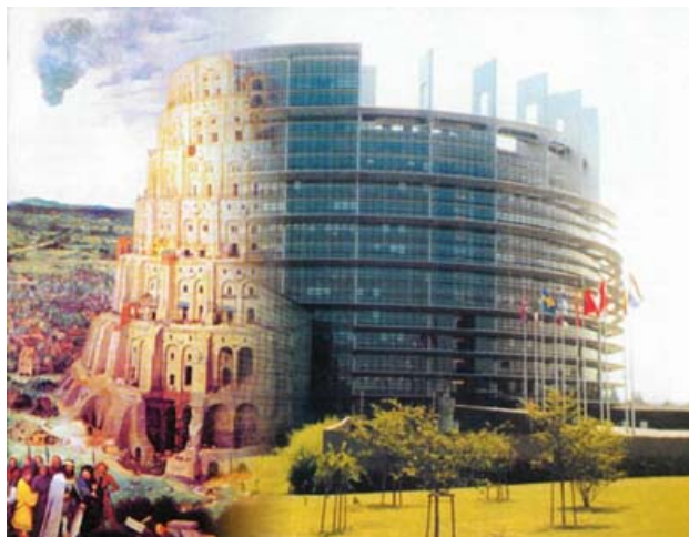
Ако је ЕУ нова Вавилонска кула, како да се тек преговарачи о КиМ споразумеју

У косовској партији, поред Срба и Албанаца, најризицијну улогу има свакако Европска Унија. Главни проблем ЕУ је тај што она има 27 министарстава иностраних послова и што јој је потребан консензус свих 27 земаља чланица да би се постигао договор. Роберт Каган је добро приметио да Америци фали један телефонски број за Европу.