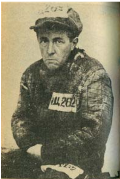
Солжењин око 1953. године

На моју велику жалост, у Русији још нема конструктивне,