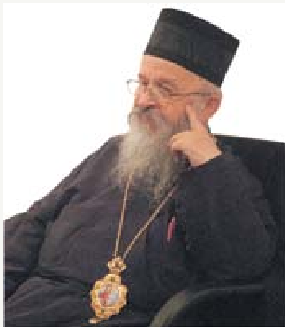
Његово преосвештенство владика рашко-призренски и косовско-метохијски Артемије

Знате да долазимо из Србије, са Косова и Метохије, тог српског Јерусалима, колевке српске