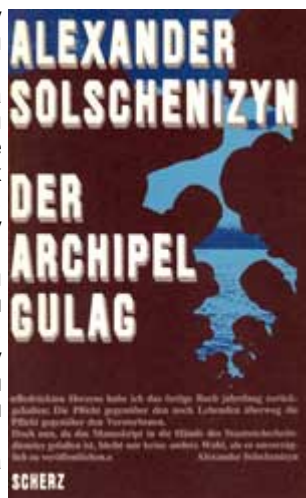
Насловна страна “Архипелага ГУЛАГ” На немачком

Солжењин: Моје детињство и одрастање пратили су Шилер