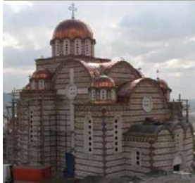
Црква Светог Димитрија у Косовској Митровици