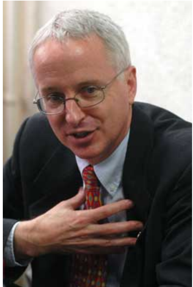
Амбасадор САД Камерон Мантер

САД, Русија и Европска унија - треба да саопшти генералном секретару УН Бан Ки Муну да ли је постигнут неки напредак. Стога се поставља питање шта ће се догодити после 10. децембра?