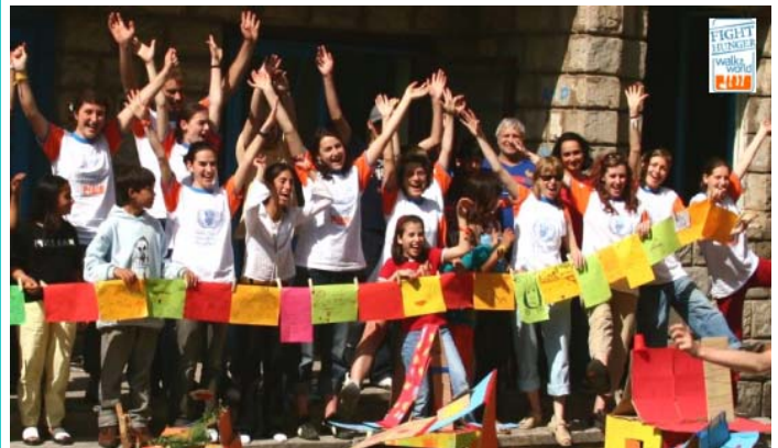
Помоћ у акцији за борбу против глади у свету

- Говорићу у своје име. Не мислим да Срби - користим их овде као пример - цене реч, већ дела и оно што радимо. Најбољи начин да побољшамо имиџ не само у Србији, већ и широм света, јесте оно што радимо, ствари попут повећања размене младих људи и студентата који одлазе у Сједињене Државе. Имамо неколико програма размене младих људи, за средњошколско и универзитетско доба, научне раднике, да бисмо побољшали своју економску присутност овде. Економско присуство се не своди само на обезбеђивање посла, или да људи науче нове методе менаџмента, већ и да се разговара о улози бизниса у друштву,