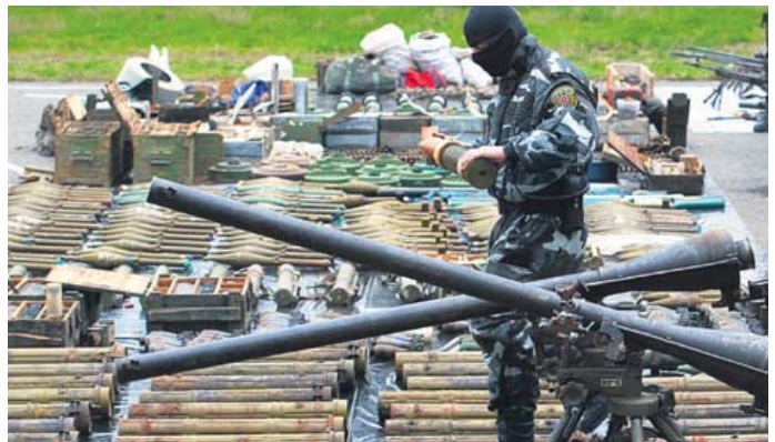
Оружје и опрема заплена у акцији македонске полиције

Као и приликом ранијих сличних активности македонске полиције, са званичним коментаром огласиле су се власти у Тирани. У саопштењу Министарства спољних послова суседне Албаније, које је пренела Сонила Ватију, портпарол, изражена је „дубока забринутост у вези са догађајима у Македонији”. Од власти у Скопљу је затражено „да избегну било који вид притисака и употребе силе од стране припадника полиције у области јучерашње акције”.