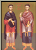
Свети Козма и Дамјан