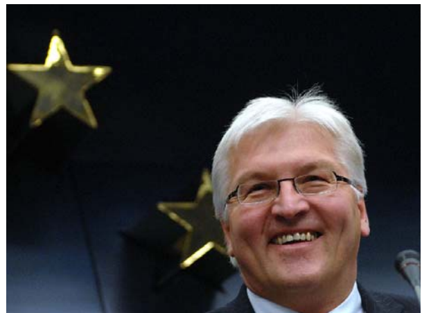
Шеф немачке дипломатије Франк-Валтер Штајнмајер

Министар Штајнмајер је нагласио да је решавање статуса јужне српске покрајине "веома осетљиво", као и да званични Берлин и међународна заједница засигурно нису "наивни када је у питању развој догађаја на западном Балкану".