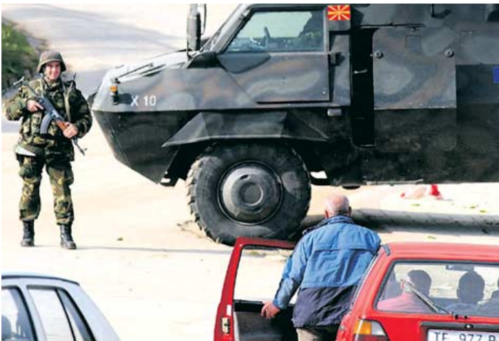
Блокада на путу за Тетово

Скопље, 5. новембра – Захваљујући антагонизму политичких присталица две водеће албанске партије у Македонији, овдашњи полицијски органи лако долазе до информација безбедносног карактера. У међусобној трци за превласт на терену, симпатизери ДПА Мендуха Тачија – који је у владиној коалицији – и приврженици опозиционог ДУИ Алија Ахметија полицији сервирају прецизне информације о деловању противничке стране.