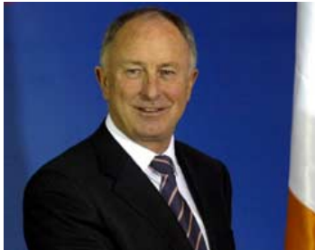
Министар спољних послова Ирске Дермот Ахерн

Министар спољних послова Дермот Ахерн, који је крајем недеље на балканској турнеји разговарао са ли-дерима БиХ, Београда и Приштине, нагласио је да су правила ирских мировних мисија веома стриктна. „Ми се бавимо тим питањем у светлу неколико сценарија који се могу догодити после 10. децембра“, рекао је Ахерн. „С правног становишта морамо да знамо да ли ћемо или не наставити своју мисију. У принципу, ми желимо да наставимо мисију, али морамо бити сигурни да би она била утемељена на легалној основи.“ Министар за Косово и Метохију Слободан Самарџић јуче је за Танјуг рекао да у овом тренутку нико са сигурношћу не може да процени развој догађаја после 10. децембра, али да он очекује