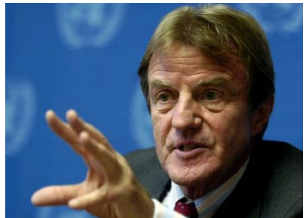
Шеф француске дипломатије Бернар Кушнер

Шеф француске дипломатије Бернар Кушнер оценио је данас у Паризу да постоји "мала шанса" да преговори о будућем статусу Косова и Метохије успеју, пренели су домаћи медији.