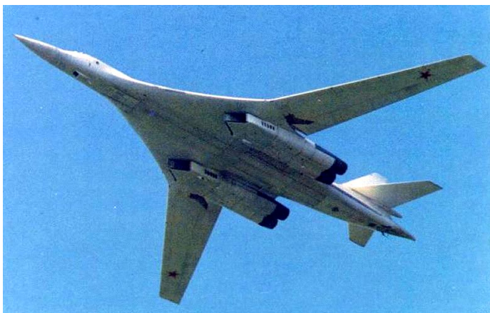
Стратешки бомбардер Ту-160

У званично прихваћеној стратегији нуклеарног одвраћања Москва се досад ослањала на тзв. нуклеарну тријаду састављену од интерконтиненталних ракета на копну - стационарних у шахтовима, мобилних или базираних на железници, поморских - на ракетним подморничким крстарицама и ваздухопловних - базираних на стратешкој авијацији бомбардера „Ту-160“ и „Ту-95МС“.