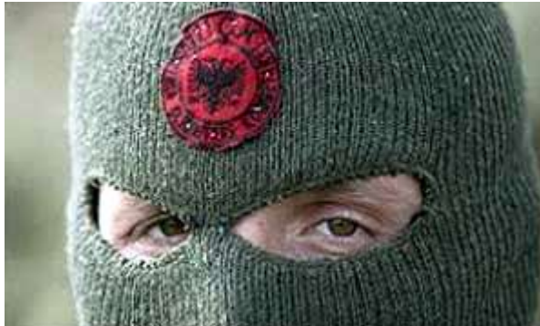
Непрекинута традиција 1 - ОВК (УЏК)-АНА(АКШ)

Када се ради о спољним утицајима и нашој спољној политици, сматрам да нам је најцелисходније да будемо ван било каквих блокова