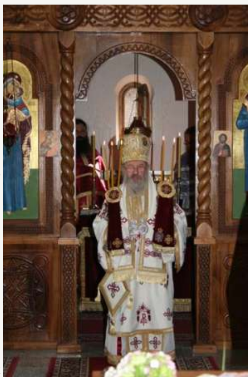
Епископ рашко-призренски гг. Артемије

успеју, применити Ахти-саријев план који њима у потпуности одговара и који, заправо, представља независност. Мислим да је Америка пристала на наставак преговора како би покушала да убеди и земље које не прихватају независност Косова и Метохије у супротно, али охрабрује чињеница да је Русија истрајна у свом ставу да то не прихвати. Зато сам сигуран да, уколико и Србија остане чврста у свом ставу, ни Русија неће попустити.