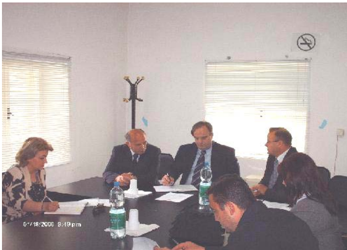
Актуелни министар Бранислав Грбић у посети Косовској Витини

Лидер СДС Славиша Петковић каже да он очекује да ће добити најмање три посланичка места.