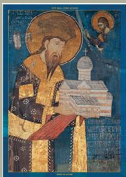
Царска лавера манастир Високи Дечани и његов ктитор Свети Краљ Стефан Дечански