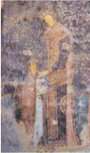
Света Краљица Јелена

Ево време покајања и дан спасења! Пази, душо, да ти ђаво не ослаби ум - јер мало времена боривши се са њим, победићеш, побећи ће од тебе. Не устраши се његове забуне ни замке, јер немоћан је он да стоји пре лицем оних који се боје Господе и имена Господња.