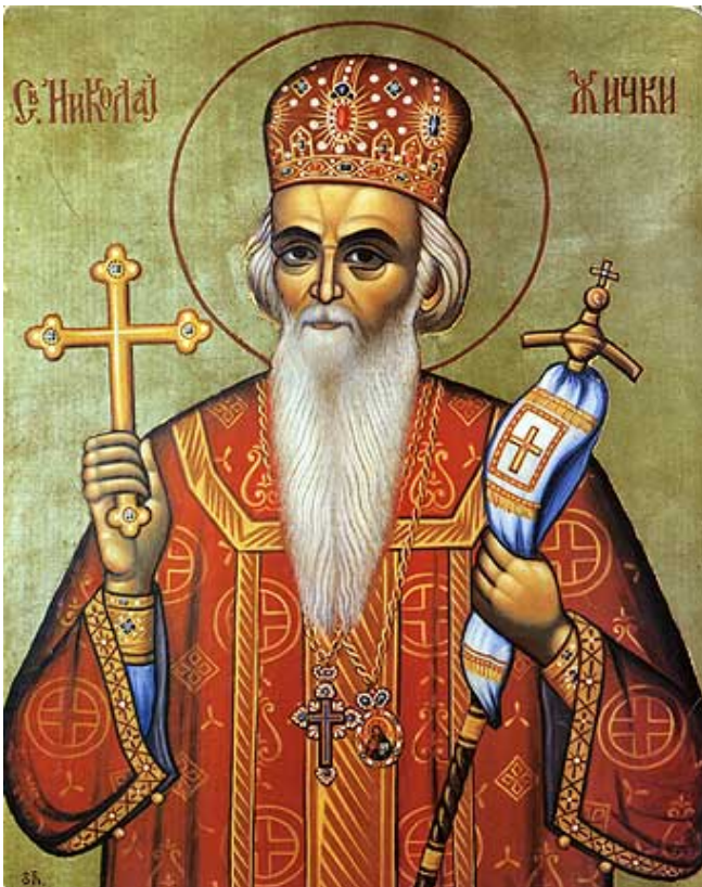
Свети владика Николај Велимировић

Господе Исусе Христe, Боже наш, прими од мене недостoјног слуге Твога молитву за непријатеље моје и наше, и опрости нам све грехе наше, буди милостив свим непријатељима нашим који нас мрзе, или вређају, или прогањају, или муче, и немој им судити како заслужују, него по великој милости Твојој обрати их све: неверне правоверју и побожности, а верне да се уклоне од зла и чине добро - како не би нико од њих погинуо, због нас, недостoјних слугу Твојих.