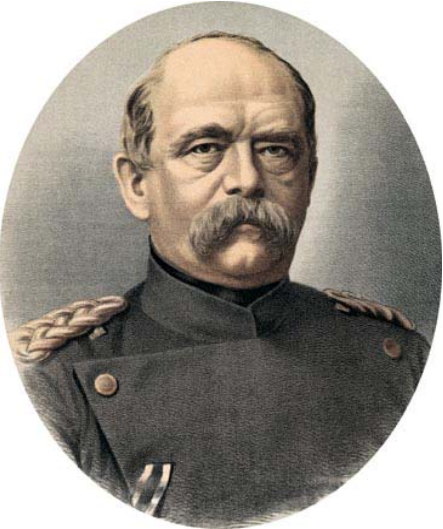
Ото фон Бизмарк

Одговор на ова питања намеће се сам по себи. Две реалне претње по зацртани „косовски план“ Запада јесу могуће реакције Срба у БиХ, као и Републике Србије. Сада све то треба релативизовати и Србе са обе стране Дрине „демократски убедити“, новом причом о „европској перспективи“ и „европској будућности“ у то да, у случају албанског проглашавања независности Косова ништа не предузимају.