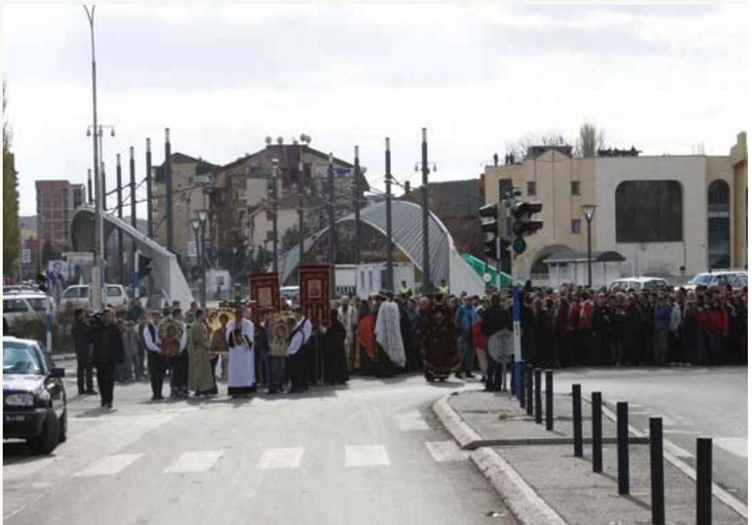
Косово и Метохија је српско, а не само Митровица - Литија на Митровдан

ескалација насиља), зависиће од става међународне заједнице (САД и ЕУ), као што је зависило и све оно што се догађало у протеклих осам година. Једноставно, косовски Албанци за све че-