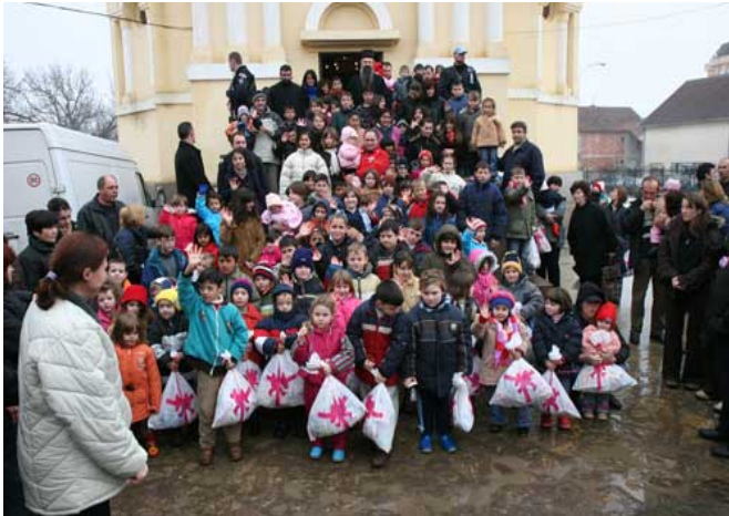
Малишани са божићним пакетићима пред храмом Св. Флора и Лавра косовских првомученика

Поздрављајући повратнике и честитајући им наступајуће празнике владика их је позвао да у овим пресудним месецима покажу храброст и устрајност. Он је нагласио да широм света има и много оних који желе да помогну Србима, не само да остану на својим огњиштима, већ и да се у своје домове врате и бројни прогнаници. Манастир Високи Дечани је у току 2007. године поред редовних активности у оквиру Дечанског хуманитарног фонда, реализовао и неколико пројеката за повратнике у сарадњи са Норвешком Амбасадом из Београда (канцеларија у Приштини) и Међународном православном хуманитарном организацијом ИОЦЦ из САД. Захваљујући овим пројектима за више десетина породица у Метохији обезбеђене су пољопривредне машине и возила, а изграђен је и већи број штала за стоку, како би се ојачао економски живот повратничких села.