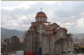
Црква Св. Димитрија у Косовској Митровици