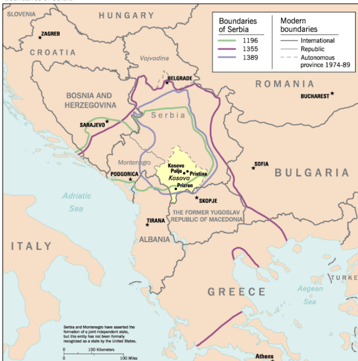
Границе Србије од 12.-14. века и у 20. веку