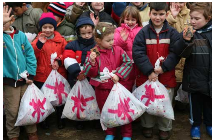
Божићна радост за децу и повратнике на Косову и Метохији