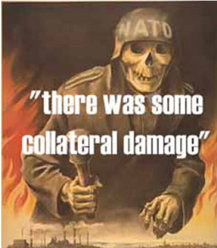
"Било је колатералне штете"

Косово је део српске територије, пре свега, оно је колевка средњовековне српске културе и традиције. У седамнаестом и осамнаестом веку почели су да надиру Албанци. Нарочито после Другог светског рата, Албанци су у великој мери запосели овај регион, а сваке године потом њихов број се умножавао и демографска слика је мењана. То је, дакле, важан разлог. И то је стратегија албанских лидера. Додајмо томе захтеве Албанаца за време Милошевићеве владавине, што је произвело непримерене мере. Грешака је највише било у неприлагођеном приступу овом проблему. Бивша Југославија била је лабава заједница република, распала се као и Совјетски Савез. Космет и Војводина се не могу поредити са федеративним републикама, то су делови Републике Србије. Устав бивше Југославије је оставио доста простора републикама, па и покрајинама да размишљају о независности, а