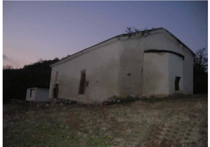
Црква Светог Ђорђа (14. век) - Ораовица, општина Прешево