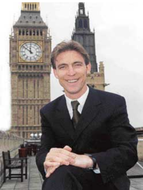
Џим Марфи, министар Велике Британије за европска питања

Специјални изасланик Ахтисари уложио је 14 месеци у први круг преговора, током којег је било организовано 15 рунди директних разговора и 26 посета региону. Затим је "тројка", коју су чинили представници ЕУ, САД и Русије, посредовала у другом кругу разговора, који је био интензиван и трајао је четири месеца. Све стране су искрено учествовале у покушајима да се премости