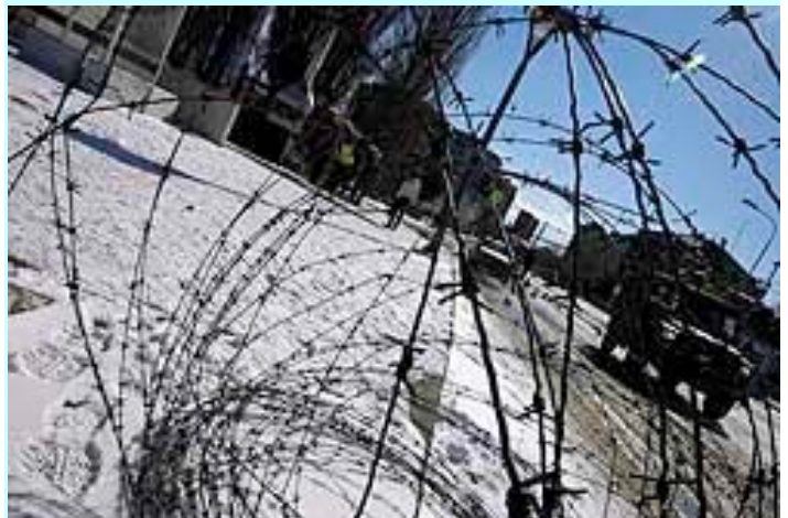
... И бодљикава жица

се смењивали новинари, али и неки од припадника Косовске полицијске службе, КФОР-а и УНМИК-а. Тренутак када Хашим Тачи објављује независност био је готово игнорисан. Само је једна жена устала, пришла најближем екрану, револтирано променила канал и наставила да пије