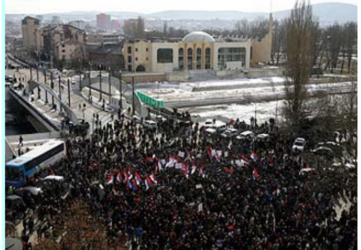
КОСОВСКА МИТРОВИЦА, 18. ФЕБРУАР: Поглед на југ

У порукама се изражава љутња и понавља позив на стрпљење и уздржаност. Наговештава се да ће бити потребно време да Србија заштити своје интересе и једног дана поврати отето Косово.