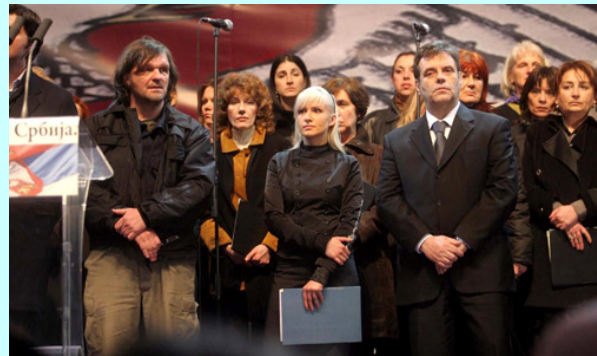
Интонирање химне "Боже правде"

"Траже да се одрекнемо наше браће на Косову. Говоре нашој браћи на Косову да су, не излазећи из својих кућа, отишли у другу државу. Нису и никад неће. Говоре им да су раздвојени од нас. Нису и никада неће бити", рекао је он.