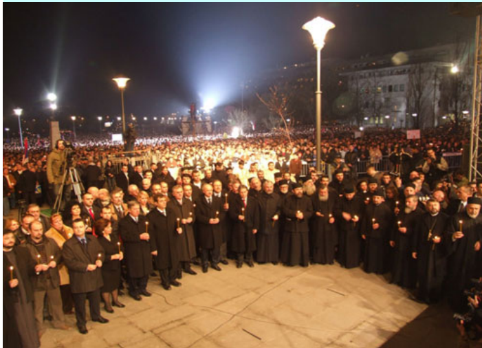
Молебану је, уз велико мноштво народа, присуствовало више министара на челу са премијером, као и престолонаследник

Молебан је испред Спомен-храма Светог Саве на Врацару служен по благослову Патријарха српског Павла, а предводио га је Митрополит црногорско-приморски са архијерејима и свештенством Српске православне цркве, уз учешће великог броја људи.