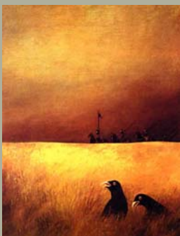
Косово - поље црних птица - косова