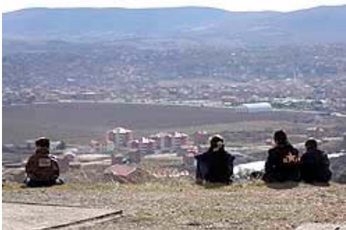
Поглед на Косовску Митровицу

али и комшије с којима се, онако у ходу, поразговара о породици и предстојећем дану. Они који су обавили куповину журили су у храм Светог Димитрија, где је владика Артемије, у присуству престолонаследника Александра Карађорђевића и његове супруге Катарине, одржао молебан и поручио: "Ово је наша отаџбина, ми резервне немамо."