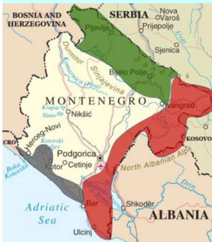
Осенчене области угрожене развојем ситуације на КиМ

Елем, Силајџићева порука, изречена у више наврата у последње време, да он одбија да преговара са Хрватима и Србима о «реформи» Устава БиХ све док не буде решен статус Космета - требало би да упућује и на Силајџићев циљ. Наиме, највећи део бошњачке политичке и интелектуалне елите уверен је да њихов политички и државни циљ - назван «грађанском БиХ» - неће бити ближи остварењу све док на Космету буде владао «статус кво». Такво уверење почива на њиховој слободној процени да Брисел и Вашингтон не врше жесток политички притисак на Републику Српску - какав у Сарајеву прижељкују - како наводно не би истовремено