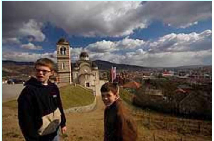
На улици деца....

На температура од минус шест степени, дувало се у шаке, премештало с ноге на ногу, шетало по гужви, али кући се није ишло. У Долчевити су