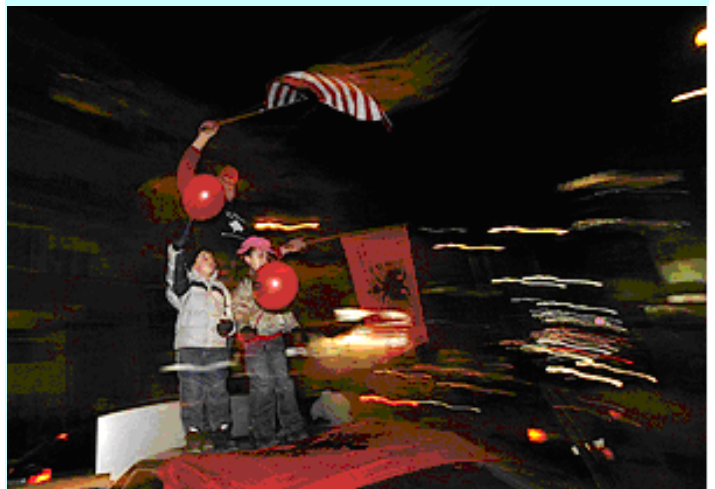
Прослава независности у Приштини

Црни капут, на глави црни шешир, а очи сакривене иза црних наочара – Ветон Сурои, председник партије ОРА, главом и брадом. Није расположен за разговор, чак ни када му се (на српском) пребаци да би на овај дан могао да покаже мало више уважавања за новинаре, припаднике српске мањине. Само се осмехнуо, одмахнуо руком и отишао.