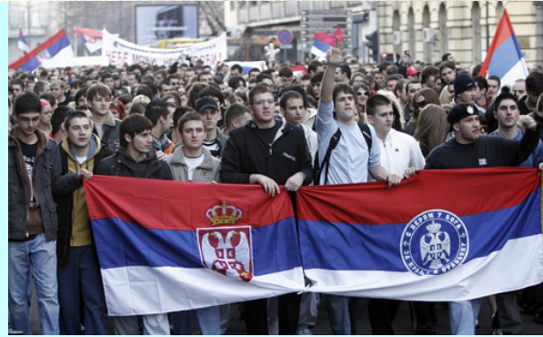
Долазак учесника на митинг

Он је упитао "има ли народа на свету од кога силници, као данас од Срба, траже да се одрекне свега што јесте. Ако признамо да нисмо Срби, обећавају да ће нам као народу без памћења и без поректа бити боље".