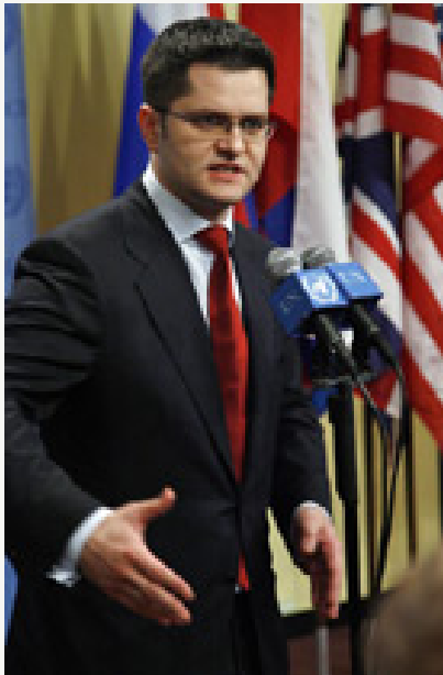
Вук Јеремић, министар иностраних послова Републике Србије

Институција чија је основна одговорност одржавање међународног мира и безбедности, на основу Повеље Уједињених нација, јесте Савет безбедности. И, 1999, после 78 дана бомбардовања моје земље, он је усвојио резолуцију – и данас још важећу – којом се УН даје овлашћење да управља јужном српском покрајином Косово и експлицитно и недвосмислено потврђује суверенитет и територијални интегритет моје земље. У