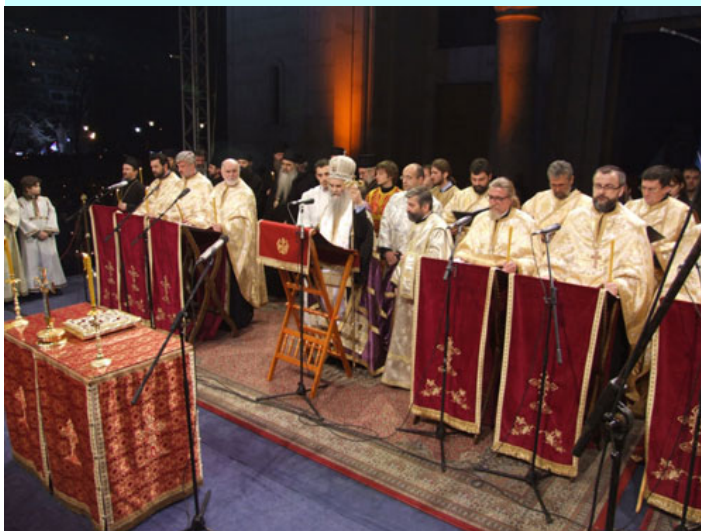
Молебан пред храмом Св. Саве

Плато испред храма био је потпуно испуњен људима који су стигли са протеста испред Дома Народне скупштине. Молебану је присуствовао премијер Војислав Коштуница, више министара, посланика, принц Александар Карађорђевић са супругом Катарином и друге јавне личности.