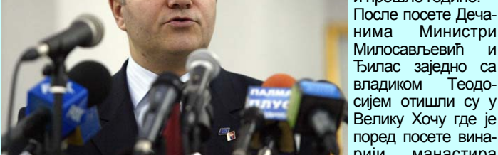
Министар Млађан Ђукић

Министарство пољопривреде је суму у истом износу дало манастиру Дечани и прошле године.