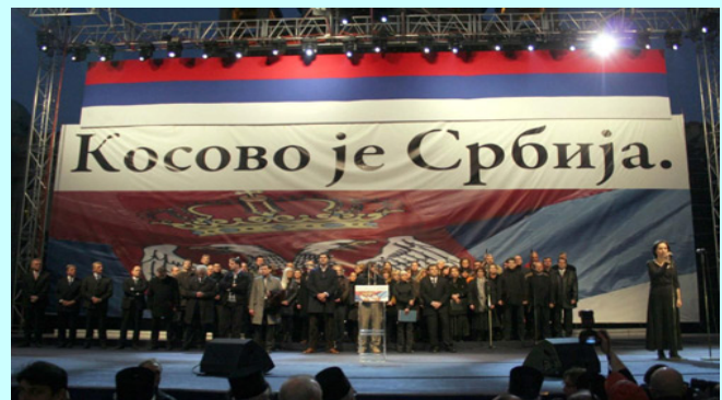
Говорници на подијуму

"Који смо то Божији, људски или европски закон прекршили? Који то договор нисмо поштовали? Које то нисмо пружили руку пријатељства и сарадње, нудећи оно што никоме никад није понуђено. Светски силници кажу - то није довољно. Биће довољно, поручију они, кад ви Срби пристанете да будете понижени. Кад потпишете своје понижење. Никад и нико неће добити мандат српског народа да пристане на такву недостојну трговину. Никада и нико!", поручио је премијер Србије.