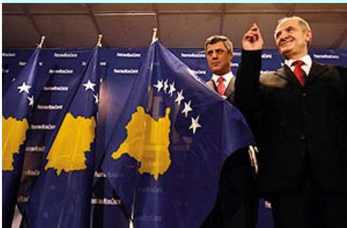
ПОД НОВОМ ЗАСТАВОМ: Хашим Тачи и Фатмир Сејдију

Ти акти и радње представљају насилно и једнострано отцепљење дела територије Републике Србије и зато су неважећи и ништавни, наводи се у скупштинској одлуци.