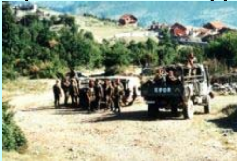
Немачки војници у околини Призрена

"Ако две стране у спору не успеју да се договоре, може да се деси да негде другде у свету дође до сличног развоја ситуације."