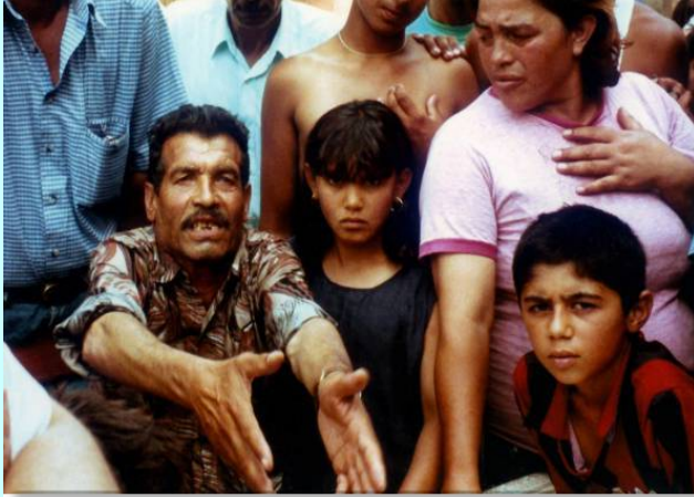
Ромске избеглице у Немачкој

и Роми за сада изузети, нова политика већ је почела да се примењује. Забележени су први случајеви враћања припадника етничке групе Ашкалија, тзв. Египћана са Косова.