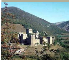
Манастир Манасија (15. в.)