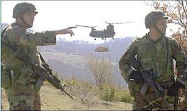
Да ли ће демаркација границе проћи без последица?