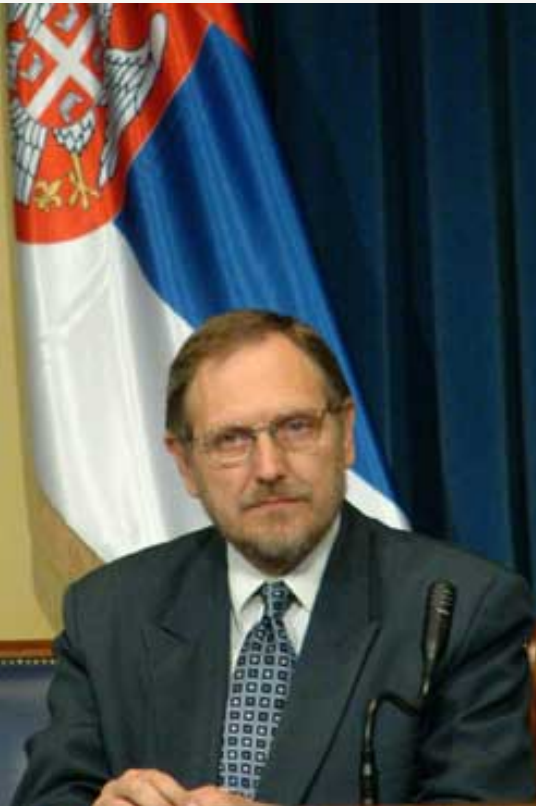
Министар вера г. Радомир Наумов

Владика Артемије је рекао да је на састанку са министром констатовано да меморандум о обнови црква и манастира који је СПЦ