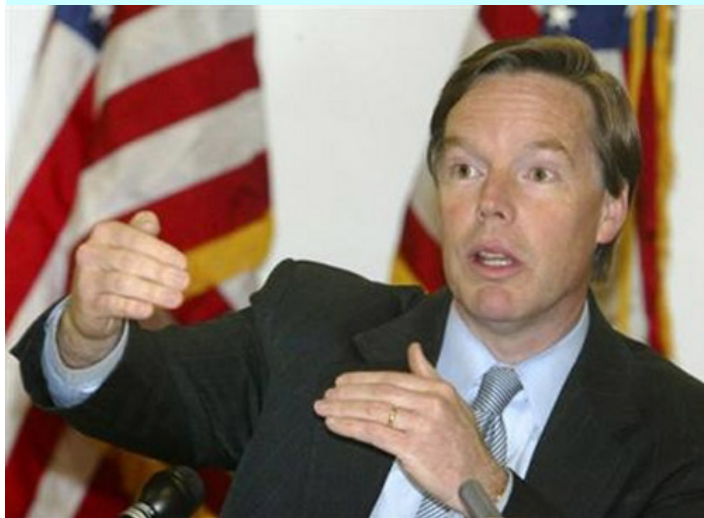
Подсекретар Стејт департмента Николас Бернс

Бернс се придружио новоименованом високом представнику Европске