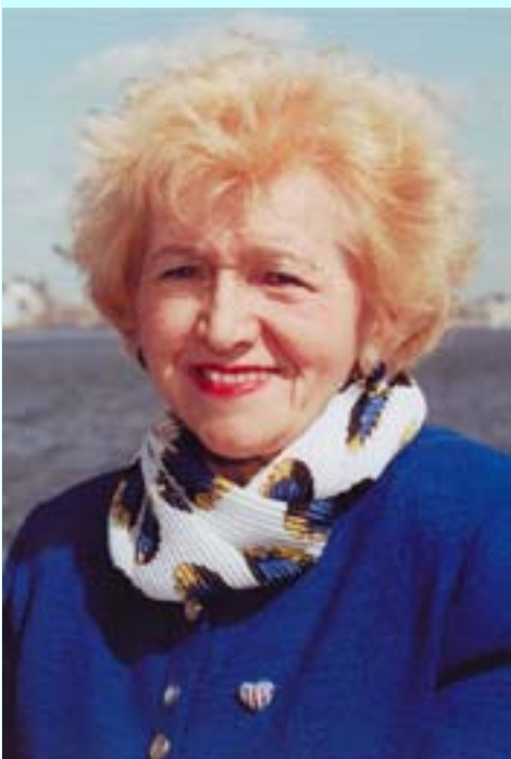
Хелен Делић Бентли

Америка ће имати велики проблем ако Балкан опет почне да се цепа, очекује некадашња америчка чланица представничког дома, српског порекла Хелен Делић-Бентли.