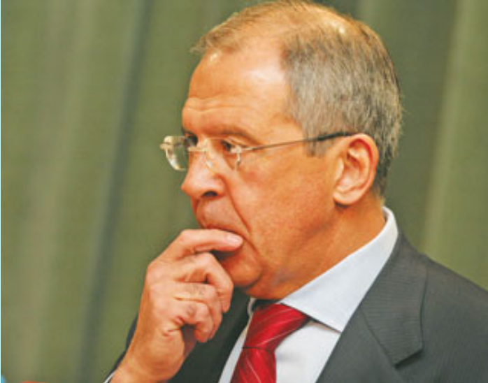
Сергеј Лавров, руски министар спољних послова