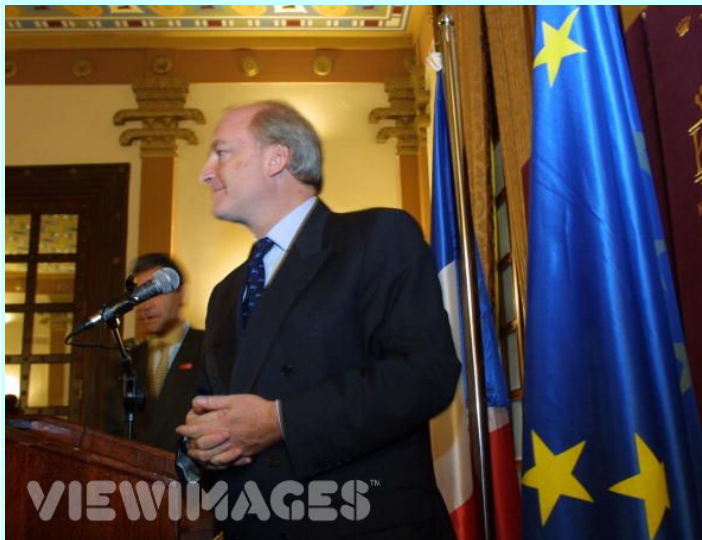
Бивши министар спољних послова Француске Ибер Ведрин

Ведрин је некадашњи дипломатски саветник Франсоа Митерана, а потом и министар у влади Лионела Жоспена (1997–2002), у време бомбардовања Југославије. О њему се причало као о једном од могућих кандидата за министра спољних послова у садашњој влади