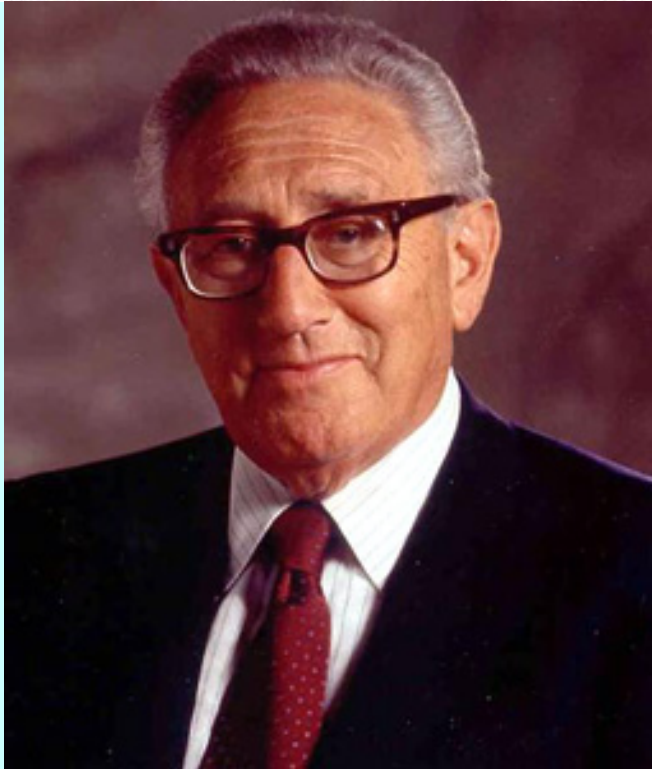
Др Хенри Кисинџер (84), бивши шеф Стејт департамента

- ...И то се догодило. Сада је други проблем: националне државе нису предале део свог националног суверенитета Европској унији, али ни део визије сопствене будућности. Њихова визија је везана за Европску унију а ЕУ није још добила лојалност и визију које би се могли упоредити са онима у националним државама. Постоји вакуум између европске прошлости и европске будућности.