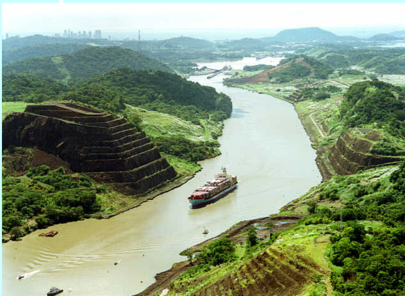
Панамски Канал - веза Атлантик-Пацифик

После проглашења независности званична Богота послала је дипломатску мисију у Панаму у нади да ће их одвратити понудом да ће колумбијски сенат прихватити претходни уговор о Панамском каналу, као и са предлогом да Панама Сити постане престоница Колумбије. Међутим, на састанку на америчком броду „УСС Мејфлауер“ панамска делегација одбила је све предлоге. Касније је Колумбија послала делегацију еминентних политичара на преговоре са колегама из Панаме, али договор није постигнут.