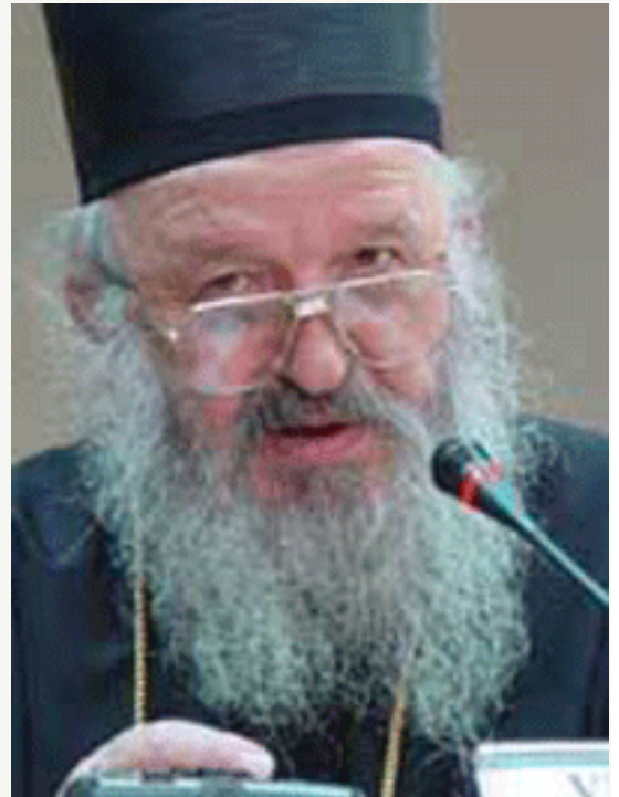
Његово преосвештенство епископ косовско-метохијски и рашко-призренски г.г. Артемије