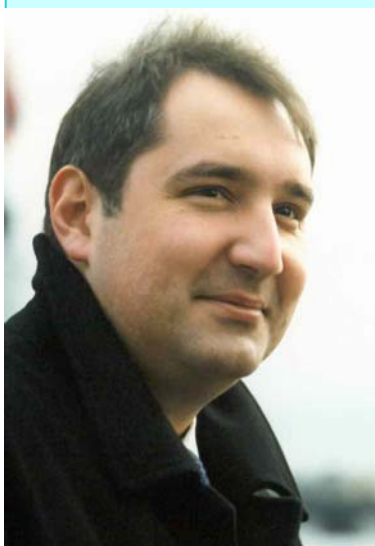
Стални представник Русије при НАТО Дмитриј Рогозин

Москва, Брисел – Стални представник Русије при НАТО Дмитриј Рогозин саветовао је јуче америчком Стејт департменту да користи 'поузданије изворе информисања и да не шири ноторне лажи' у вези са његовим иступањем у петак током телемоста између Брисела и Москве.