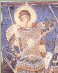
Светац-ратник из Манасије

непосредним улагањима и помоћи Србије Српској православној цркви (СПЦ) на Косову и Метохији.