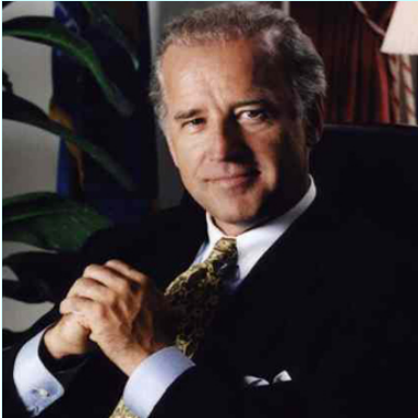
Сенатор Џозеф Бајден

Земље су биле споре у признавању Косова из најразличитијих разлога, укључујући и властите интерне правне процедуре. Бразил, а донекле и Индија, чека да се створи критична маса нација пре него што и сама начини тај корак. Обе земље желе место у Савету безбедности УН, али страхују да би предњачење по питању Косова довело до непријатељског расположења Русије и Кине, чланица