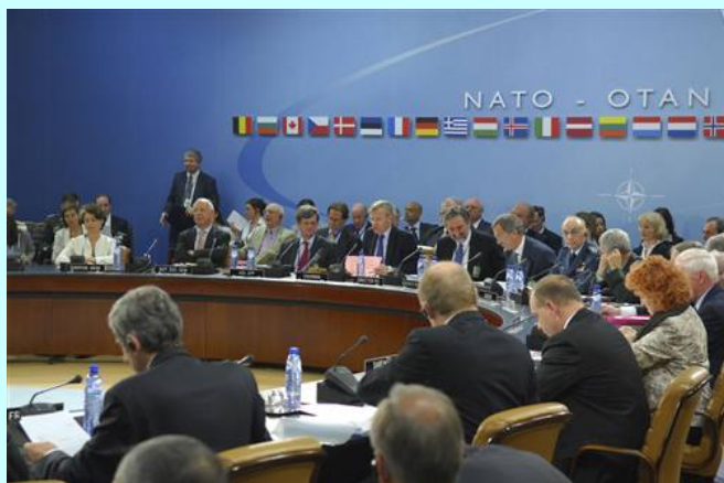
Састанак НАТО пакта

НАТО мисија у Авганистану, која је требало да покаже способност алијансе за превазилажење ограничења хладног рата и да истакне способности НАТО да се ефикасно бори у рату и да се бави пост-конфликтном реконструкцијом, посрће. Уместо да уједини алијансу зарад заједничког циља, Авганистан показује да је хваљена „трансформација“ којом се НАТО бавио била углавном само представа.