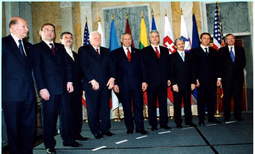
Јап де Хоф Схефер, генерални секретар НАТО пакта и генерал Пауел, државни секретар САД са премијерима нових чланица НАТО-а 2004. године

Генерални секретар НАТО-а рекао је да ће се на самиту "пружити руке" Црној Гори и Херцеговини које желе да се придруже