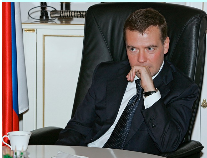
Новоизабрани председник Русије Дмитриј Медведев

„Председник одређује основне правце унутрашње и спољне политике, он је врховни командант и доноси најважније одлуке у области формирања извршне власти, он је гарант права и слобода руских грађана. Компетенције владе су, такође, велике. Влада реализује економске планове, доноси важне одлуке у области економских полова. Сама по себи, структура владе укључује