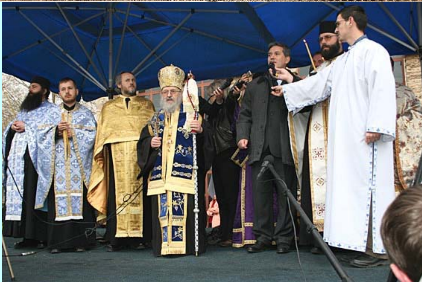
Владика Артемије: "Помолили смо се и за нас који овде остајемо и опстајемо да бисмо сачували Косовски завет."

"Косово јесте Србија али без Србије на Косову и Метохији нема ни Срба на Косову и Метохији" додао је министар.