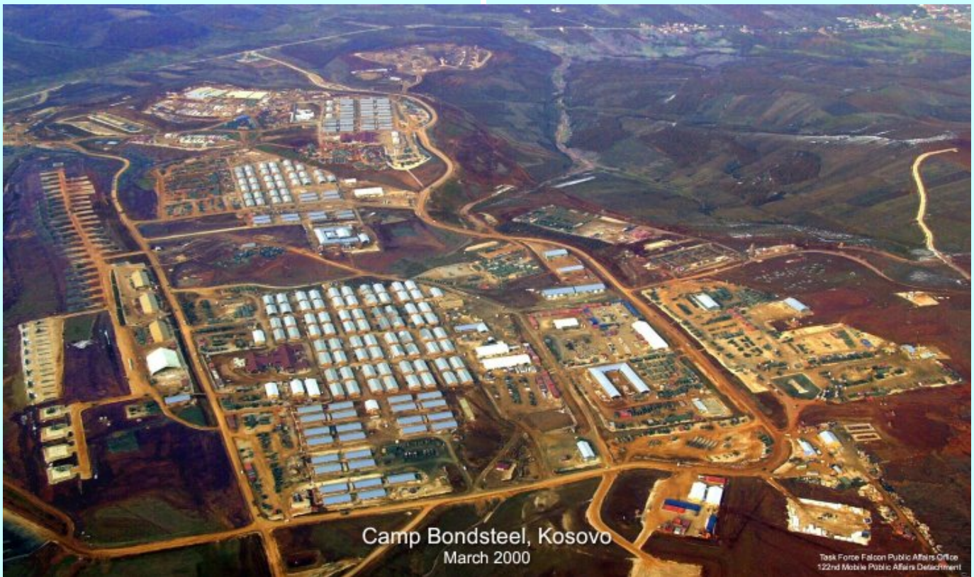
База бондстил код Урошевца

Значајно је што је америчко и немачко признање косовске независности у фебруару 2008. уследило само неколико дана након што је провашиingtonски кандидат Борис Тадић изабран за још један петогодишњи мандат у Србији, чиме је Вашингтон могао да рачуна на послушну српску реакцију. И чини се да је то засад случај.