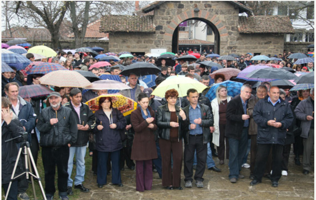
Велики број верника се окупио да се помоли за пострадале