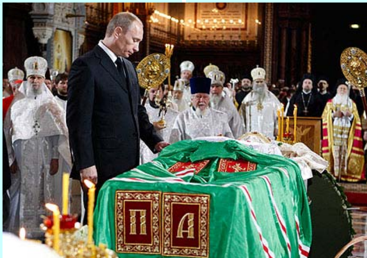
Опроштај премијера Путина од патријарха Алексија Другог