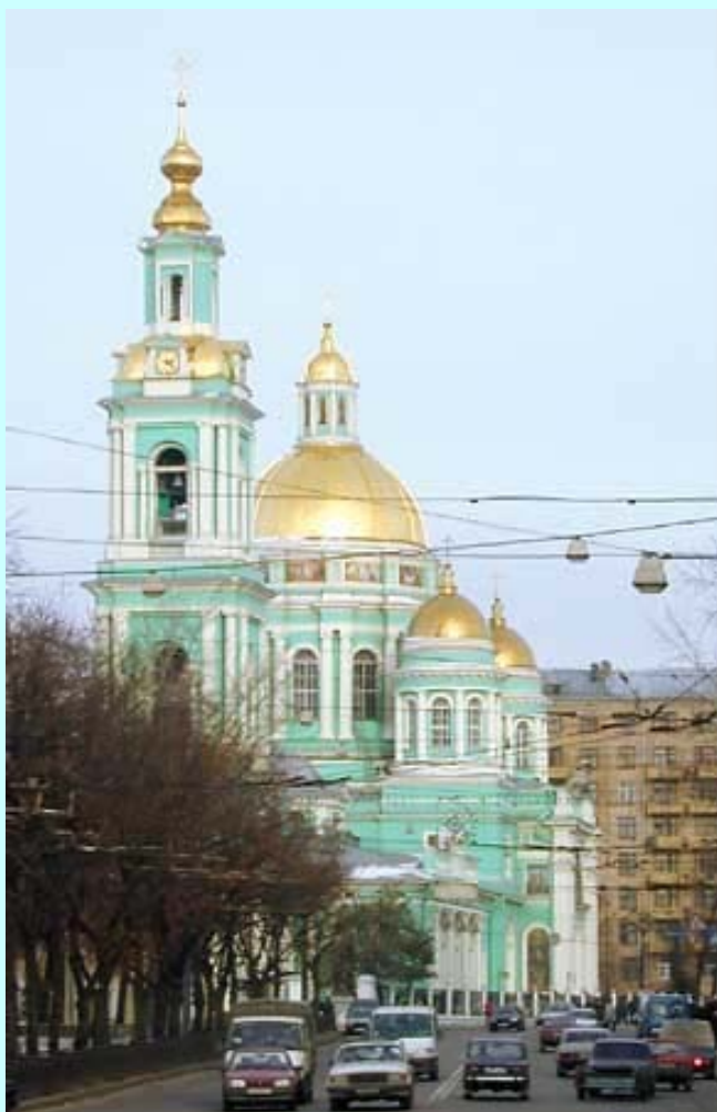
У Богојављенском катедралном храму биће сахрањен Патријарх московски и све Русије Алексије Други

Више пута сте указивали на тежак положај српског и другог неалбанског становништва на Косову. Приштина ипак, без обзира на све преговарачке напоре и разне предлоге из Београда, саопштава да ће прогласити независност. Зашто је опасан такав развој догађаја?