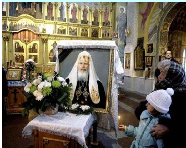
Само у цркви Христа Спаситеља за једну ноћ 10.000 верника опростило се од руског патријарха