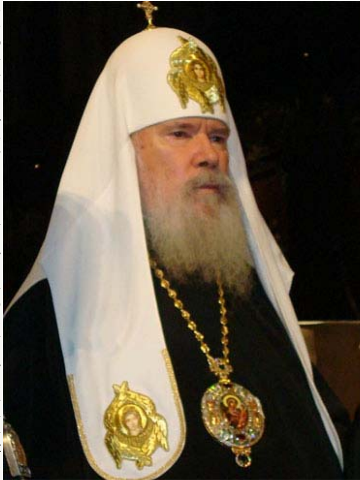
Патријарх московски и све Русије Алексije Други

Руска Државна дума прекинула је јуче пленарну седницу и