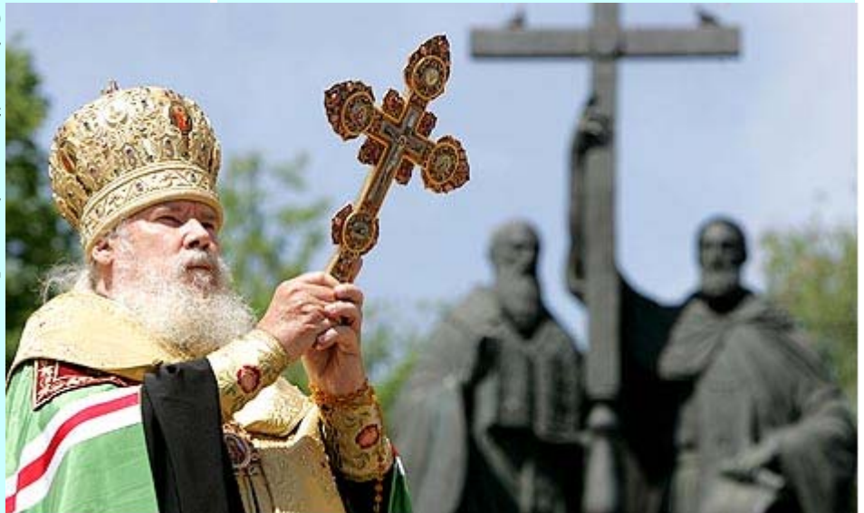
Његова светост патријарх московски и све Русије Алексеј II

апостолске цркве. Памтити и поштовати велике делатнике на њиви Божијој, надахњивати се њиховим примером – духовна је потреба сваког хришћанина. Светска културна баштина без косовских светиња била би непотпуна. Претити им – значи лишити човечанство ризнице коју су стварала многа поколења. Они који руше светиње налик су варварима који су већ претворили у pepeo и рушевине не само једну цивилизацију. Молимо се да то више никада не постане реалност.