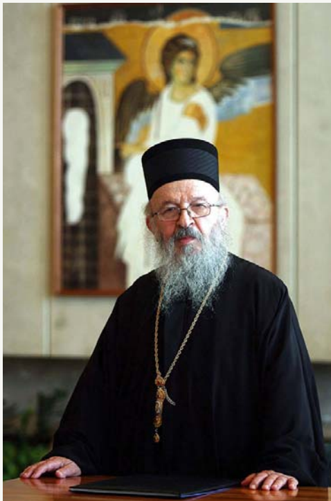
Његово Преосвештество Православни Епископ рашко-призренски и косовско-метохијски г.г. Артемије