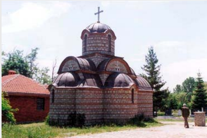
Црква Св. Кнеза Лазара у Пискотама код Ђаковице

Међународна заједница у лицу КФОР-а и УНМИК-а толерише све досадашње злочине почињене од стране Шиптара, прећутно им одобравајући и саглашавајући се са уништавањем српског народа, српске културе и српске имовине на Косову и Метохији, потврђујући тиме да је независно Косово пројекат осмишљен и наметан од стране Америке и западних сила, у коме су Шиптари само орган и тренутни добитници. Под влашћу међународне заједнице у протеклих осам година, Шиптари врше духовни и национални геноцид над српским народом, неометано чинећи највеће злочине у периоду „мира“.