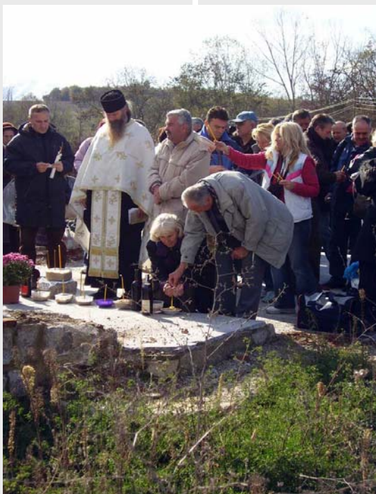
Задушнице на гробљу у Таковици

Уважена господо, без стварања услова за одржив повратак прогнаних и