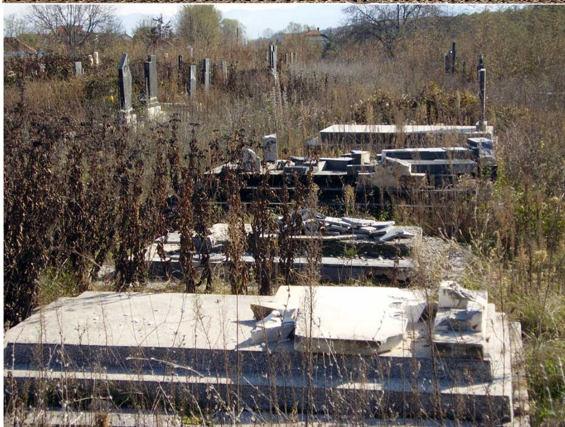
Гробље у Таковици

Највише су затајили правосудни органи. Од толиког броја почињених злочина, скоро нико није идентификован и изведен пред лице правде. О томе најбоље сведочи извештај "Human Rights Watch" од 30. маја 2006. године, којег ћете добити уз остале материјале.