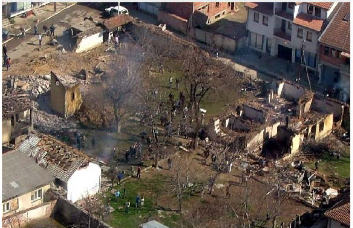
Остаци црква Успења Пресвете Богородице у Ђаковици после 17. марта 2004. године - све три фазе у једном дану - олђачкана, спаљена, срушена, материјал разнет

На жалост, овом безакоњу погодује потпуни међународни вакуум на Косову и Метохији. УНМИК и поред чињенице да Савет Безбедности није одобрио његов одлазак све више се смањује и избегава било какво конкретно ангажовање посебно у корист српске заједнице. Европска мисија нема званично одобрење Савета Безбедности нити Србије и изложена је потпуном бојкоту српског становништва док се не обезбеди њен рад у оквирима постојеће Резолуције 1244. Осим тога, и у ЕУ круговима постоје различити међусобни ставови о мисији