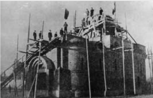
Изградња спомен-цркве 1940 - срушили су је комунисти 1950

Да ли је неактивност Комисије на локацији има за циљ пролонгирање обнове храма у Ђаковици?