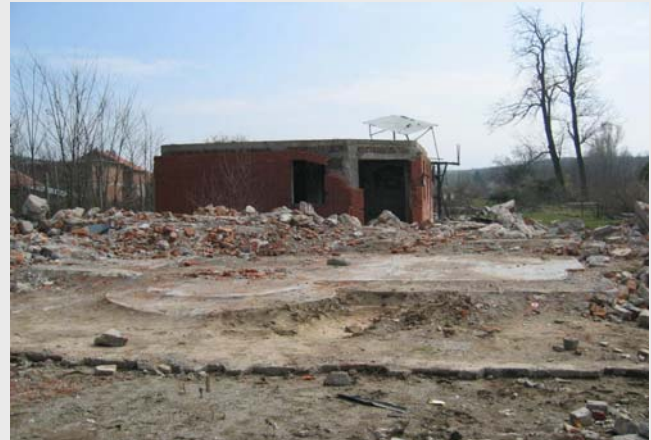
Остаци цркве Св. Кнеза Лазара у Пискотама, јуни 1999.

храмова који треба да буду обновљени у оквиру процеса обнове на основу Меморандума, али су Шиптарски представници у Комисији за спровођење обнове одмах на почетку захтевали да се храм у Ђаковици, као и манастир светих Архангела, изузму из процеса обнове. Српски представници у Комисији (представник СПЦ и представник Министарства културе из Београда), прећутно су се тада сагласили са овим захтевима Шиптара, те стога у протекле две и по године на поменуто два локалитета нису извођени никакви радови на обнови. Врло брзо, нажалост, стигло је време да беремо горке плодове овако поразног и дефетистичког става српских представника.