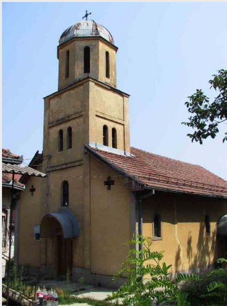
Црква Успења Пресвете Богородице у Ђаковици пре 17. марта 2004. године

Наравно, општина Ђаковица има пуно и легитимно право да оспорава власништво и СПЦ и било кога другог, али за то постоје судови и правни процес где се другој страни омогућава да заштити своја права. Општина није изабрала овај пут већ је кренула да сама суди и пресуђује. Чињеница да је реч о локацији коју је у свом писму председник општине Ђаковица 10. јула у пуном јеку радова признао као црквену рекавши да се неће на њој ништа радити без консултације са СПЦ и Комисијом за обнову Савета Европе, а затим наредио да се радови још више убрзају представља врхунац лицемерја и отворени показатељ да се председник општине осећа као лице које је изнад закона. У сваком друштву такво понашање је законски кажњиво и од УНМИК-а би било за очекивати да посредује у подношењу кривичне пријаве против извршилаца овог илегалног рада и узурпације црквене земље.