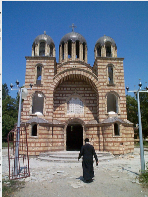
Прва фаза разарања - храм је опљачкан, обесвећен јуна 1999. године