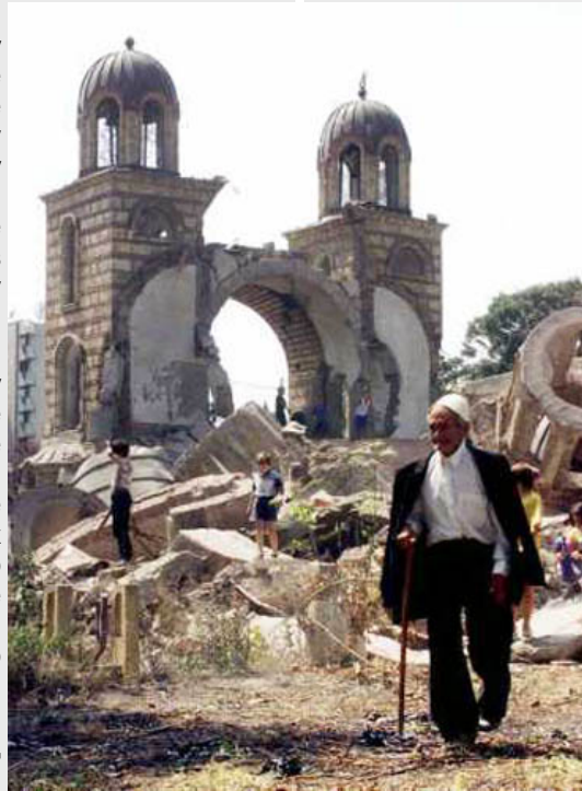
Трећа фаза - разношење материјала са храма

Најоштрије осуђујемо и изражавамо протест због најновијег скрнављења локације на којој се налазио српски православни саборни храм Св. Тројице у Ђаковици. Одлука општине Ђаковица да без икаквих консултација са власником земље (Епархијом Рашко-призренском - СПЦ), надлежним представницима УНМИК-а и Комисијом за обнову Савета Европе започне радове на месту храма, представља најгрубље кршење не само Меморандума о обнови из 2005. године у коме су се привремене институције Косова обавезале да ће поштовати договорене принципе, већ и отворено кршење имовинских права СПЦ чија се земља без дозволе власника претвара у градски парк. Затирање темеља који су остали једини сведок рушења православног храма Св. Тројице који се ту налазио, представља треће по реду скрнављење овог светог места од 1999. године, када је храм први пут минирао, а потом већина рушевина разнешена у марту 2004. године. Покривање темеља земљом без сагласности власника и одобрења надлежних међународних институција које учествују у процесу обнове представља бесраман акт институционалног насиља које се на више места спроводи против Српске Православне Цркве на Косову и Метохији и као такав указује на рапидно урушавање међународног ауторитета у Покрајини, у којој је од фебрура месеца једнострано проглашена независност.