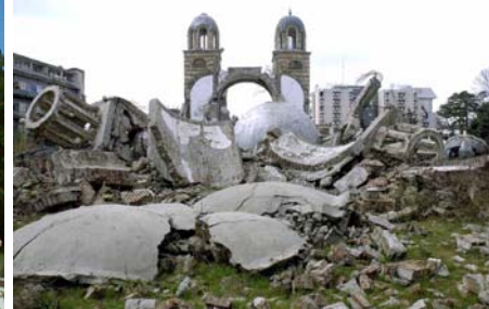
Друга фаза - Храм Св. Тројице уништен експлозијом. У трећој фази разносе се остаци