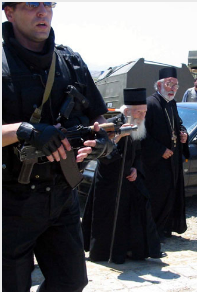
Видовдан 2004. године

Ту су и Руси које предводи делегација скупштине града Санкт Петербурга. Донели су Грачаници на дар икону Васкрсења Исуса Христа. Са жељом да се српски народ подигне, да се узнесе у Господу. Из камените Црне Горе донели су Грачаници