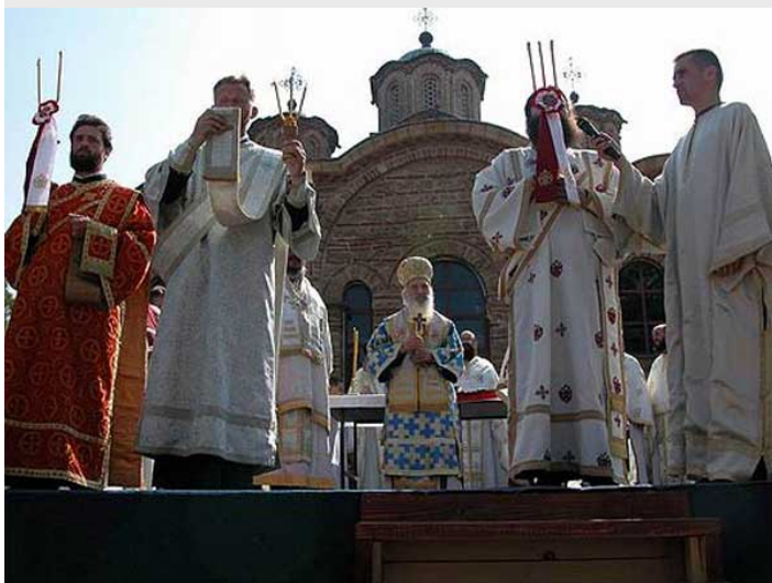
Видовдан 2006. године