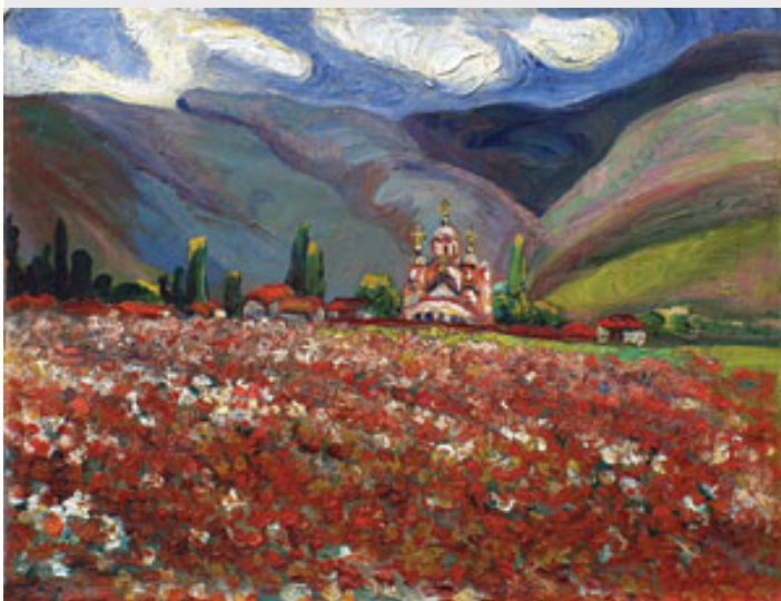
Косовски божури - Надежда Петровић (1913)

Гледам широко поље Косово. Гледам место на коме су се пре 619 година сукобиле српска војска и најмоћнија војска тога доба, турска војска. Гледам место на коме и због кога се најмоћнија армада двадесетог века устремила на Србијицу, да је уништи и