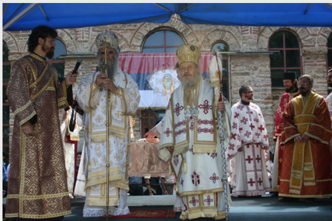
Видовдан 2008. године

Шиптари на отетој српској земљи граде, хоће да заграде Небо наше, да га заклоне. У непосредној близини Газиместана земаљски моћник, пркосник и отимач гради хотел. Упркос