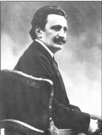
После Војскава Илића, Нушић је био српски вицеконзул у Приштини, пред полазак на дужност у Приштину, Ракић је проучавао Нушићева конзлска писма с Косова.

Један други књижевник, Григорије Божовић, који је прилике у Старој Србији познавао са самога њиховог извора, и као староседелац осећао их много дубље и болније, кратко бележи: