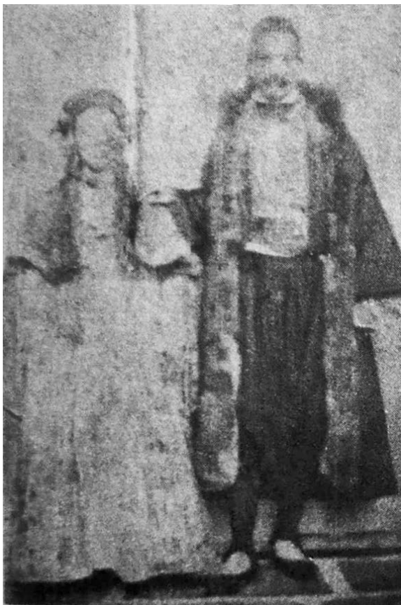
1. Slika s vjenčanja 1856. godine 45