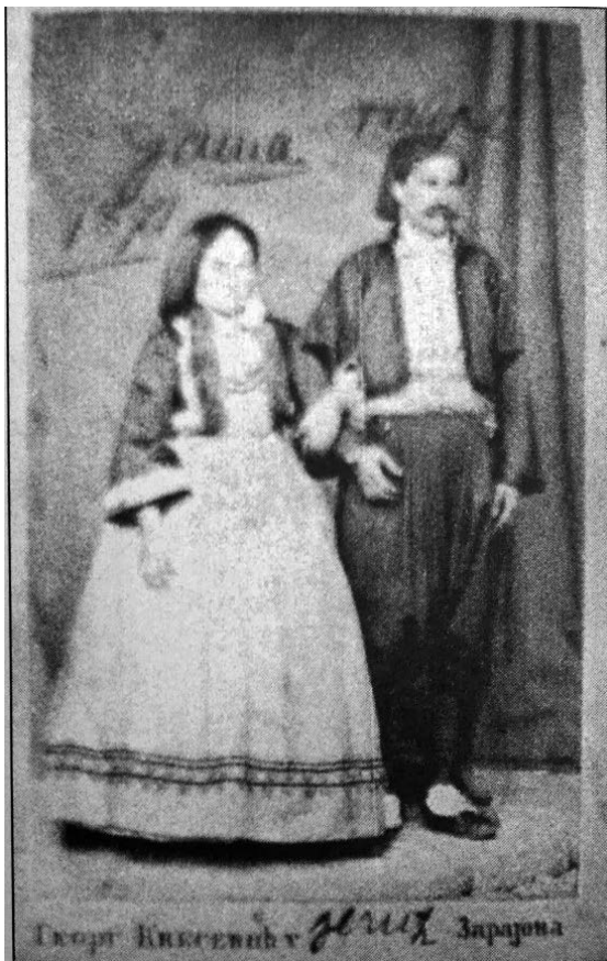
3. Slika iz 1871. godine 150

godinu kada su se vjenčali. Također, interesantno je da su tada imali petoro žive djece, ali niti jedno nije bilo s njima na fotografiji. 150