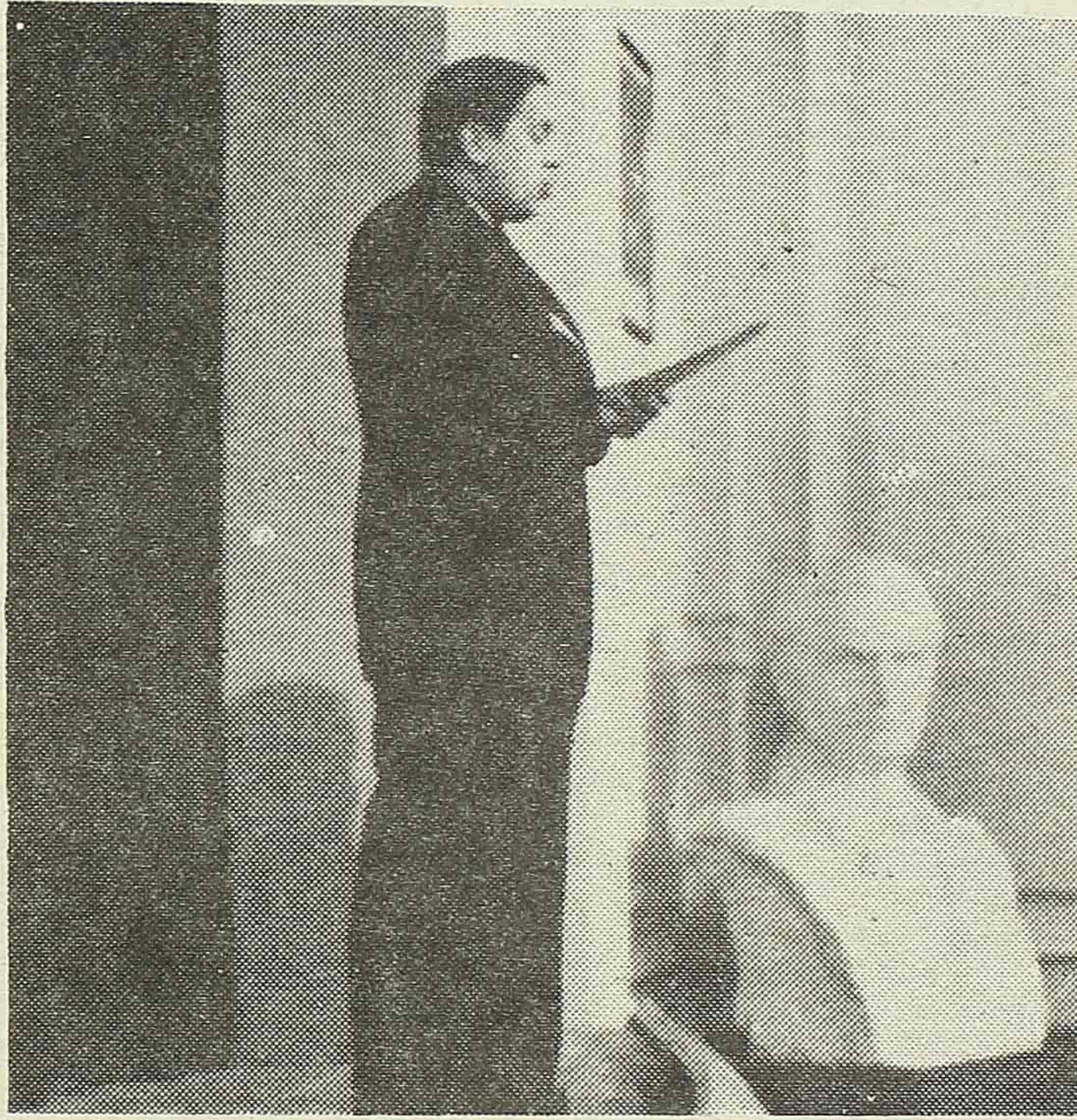
Branko Čopić čita pesme pionirima 1952. (književne večeri povodom 10 godina smrti i 80 godina rođenja)