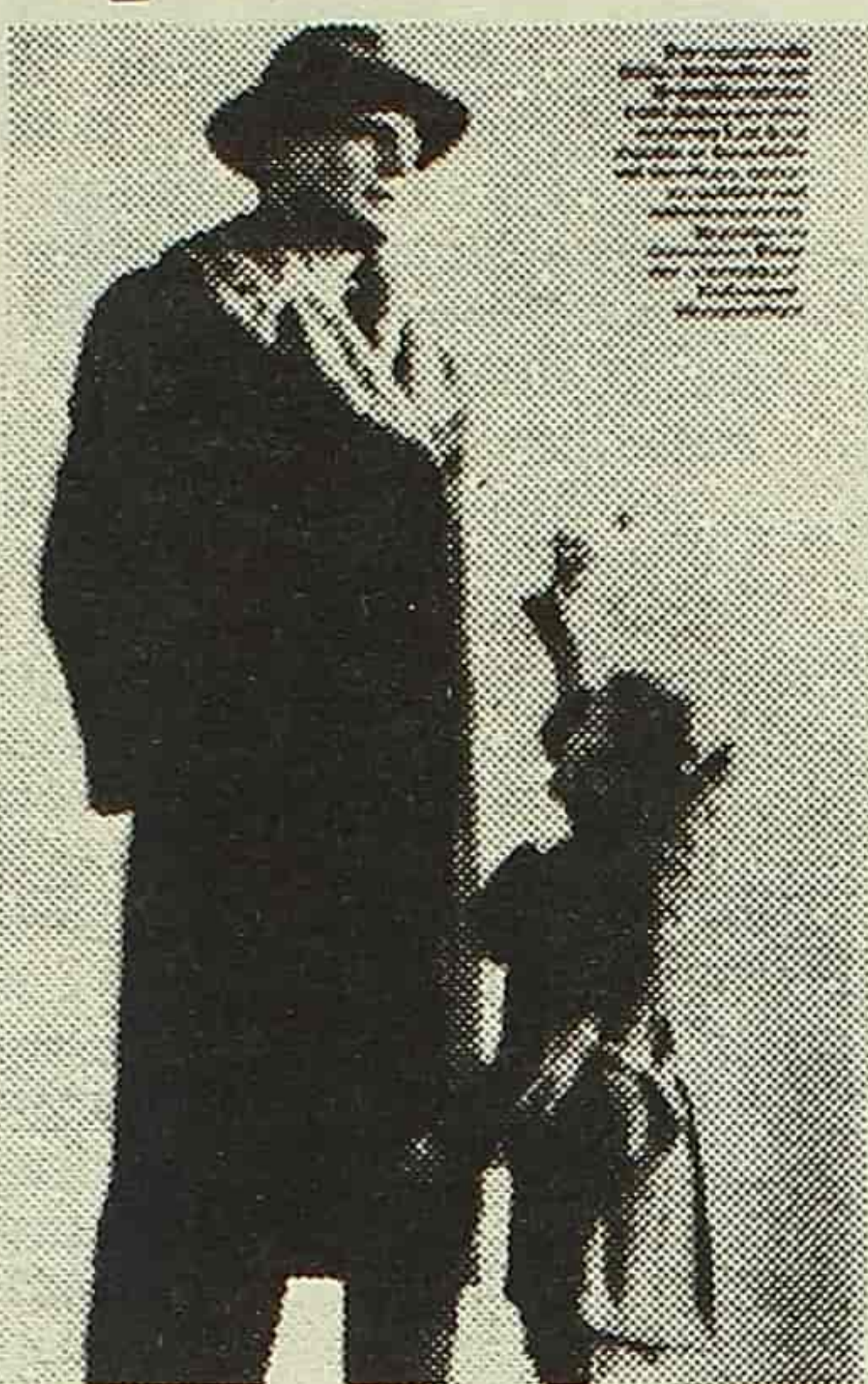
Лиајм Нисон као Оскар Шиндлер